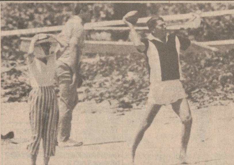
HONOLULU — Państwo Reagan na plaży. Prezydent zatrzymał się na Hawajach w drodze do krajów Azji.

Wśród odrzuconych projektów znalazła się propozycja ograniczenia godzin startów i lądowania samolotów oraz utworzenie specjalnego komitetu władz podmiejskich, którego zadaniem byłoby kontrolowanie wszystkich poczynąń związanych z rozbudową lotniska O'Hare.