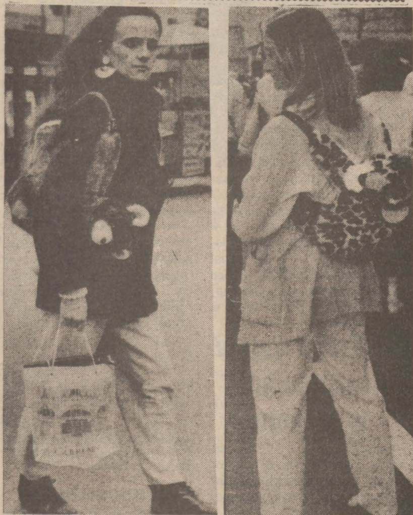
W Nowym Jorku (i zapewne nie tylko) panuje moda wśród młodej dziewczyny na noszenie różnego rodzaju plecaków — toreb w postaci zwierzątek.