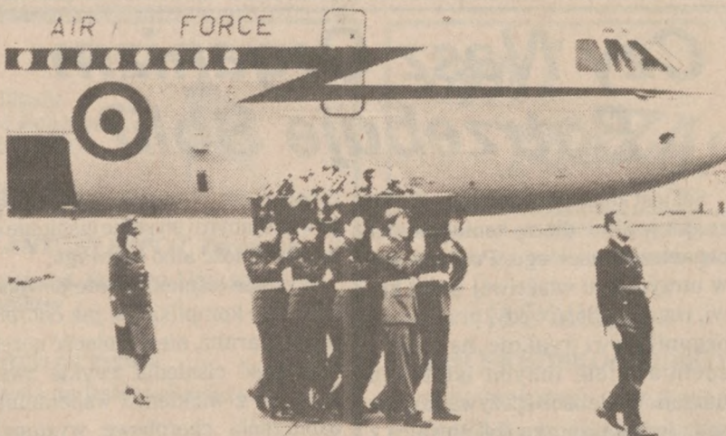
BRITANIA — Księżna Windsoru, bohaterka romansu sprzed pół wieku, nie żyje. Zmarła w wieku 89 lat w Paryżu. Jej zwłoki spoczną w kaplicy zamkowej w Windsorze. Na zdjęciu: kondukt żałobny w bazie RAF pod Londynem.