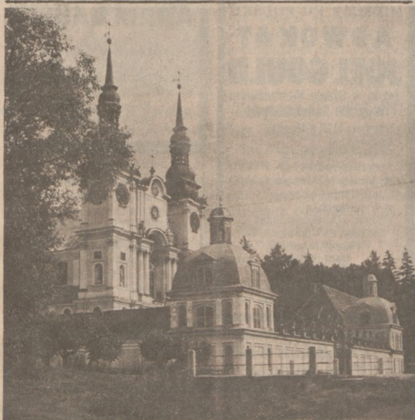
ŚW. LIPKA — Widok ogólny

Reorganizacja gabinetu premiera Indii świadczy o konsolidacji władzy nowych doradców Radziwa Gandhiego. Za rządów Indiri Gandhi nie mieli oni specjalnych wpływów na poprzednią administrację.