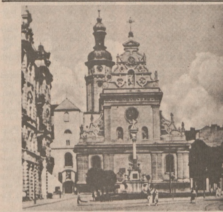
LWÓW — Kościół Bernardynów.

Jadąc gazikiem, strzelili najpierw w koła samochodu Simbillo. Przy próbie ucieczki otworzyli ogień z pistoletów i karabinów. Kierowca pojazdu uszedł z opresji cało.