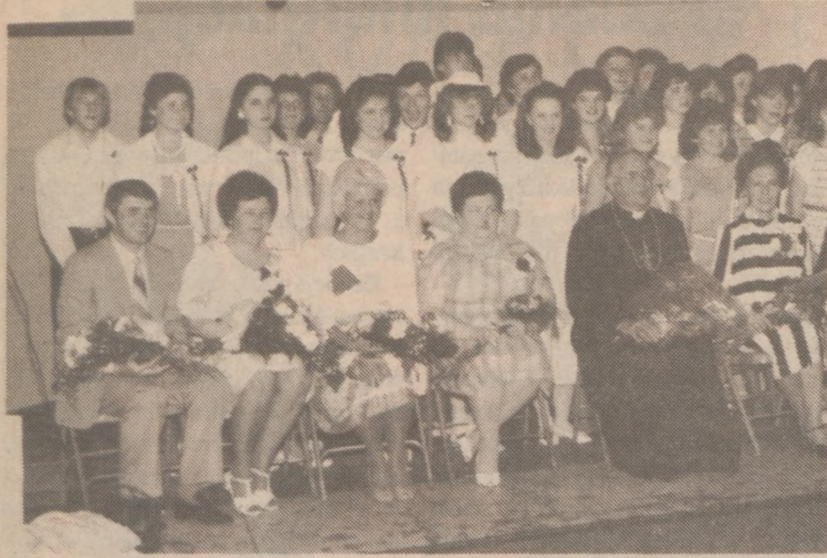
Z pożegnania klasy VIII.

Sobota, 8 rano, parking parafii Pięciu Braci Polaków i Męczenników, w południowej części miasta powoli się zapełnia. Podjeżdżają samochody, z których wysypują się gromadki dzieci. Niektórzy rodzice przyjeżdżają aż 80 mil, z dalekich przedmieść, przywożąc dzieci do polskiej szkoły. O godzinie 9 dzwonek, uczniowie wchodzą do klas, rozpoczynają się lekcje.