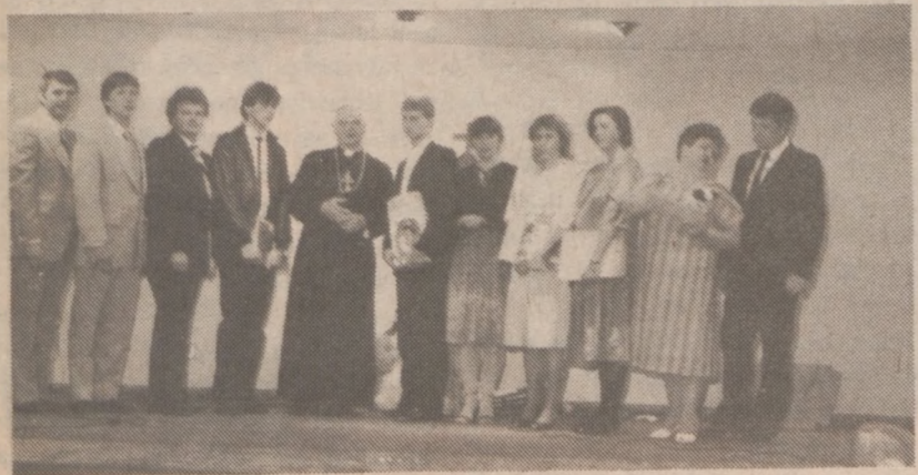
Pożegnanie klasy gimnazjalnej.

O godzinie 1 lekcje zaczyna druga zmiana i aż do godz. 4 mury szkolne wypełnia nasza młodzież. Słychać język polski, często chropowaty i o innym akcencie, ale nasz. Muszę zaznaczyć, że 80% uczniów urodziło się i wychowało w USA, więc kiedy przed komisją maturalną odczytują swoje prace, kiedy odpowiadają na pytania z historii, cytują naszych