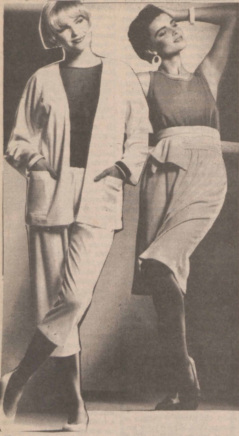
Na gorące letnie dni, na spaceru prezentujemy dwa modele. Wygodne, ładne i praktyczne.