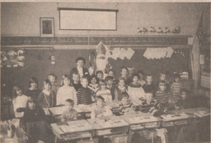
Jedna z klas ze swą wychowawczynią.