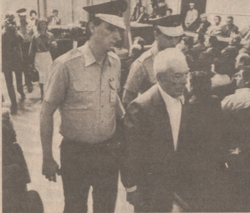
ZAGRZEB, JUGOSŁAWIA — Andrija Artukovic został skazany na karę śmierci. Sąd jugosłowiański oskarżył go o spowodowanie śmierci 900 tysięcy cywilnych osób.