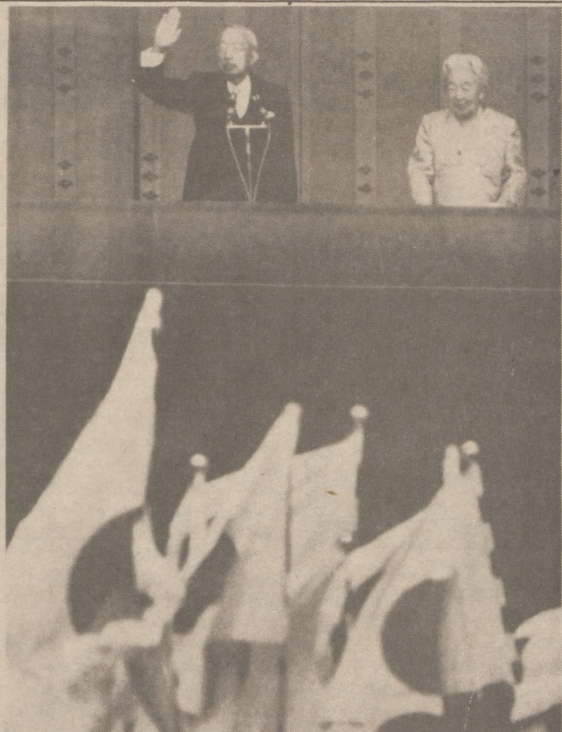
TOKIO — Cesarz Hirohito pozdrawia poddanych zgromadzonych u podnóża Pałacu Imperialnego. Cesarz (na zdjęciu) w towarzystwie cesarzowej Nagako) ukończył właśnie 85 rok życia.

Próba została przeprowadzona w pięć godzin po aresztowaniu pięciu przeciwników broni nuklearnej, którzy wtargnęli na teren, na którym miał być dokonany wybuch.