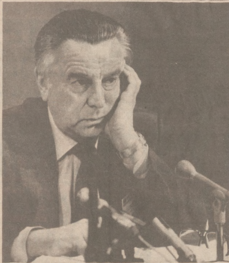
GENEWA — Niewesoła mina towarzysza ministra. Oto Jurij Issakov, sowiecki minister zdrowia, podczas konferencji prasowej w dniu 15 maja

Po Mszy św. w dolnej salce, drużyna przygotowała kawę, na stole pojawiły się smakołyki, niektóre z nich pięknie same drużny. Wreszcie pomysły, wzruszający program, który wycisnął łzy z oczu każdej Mamusi.