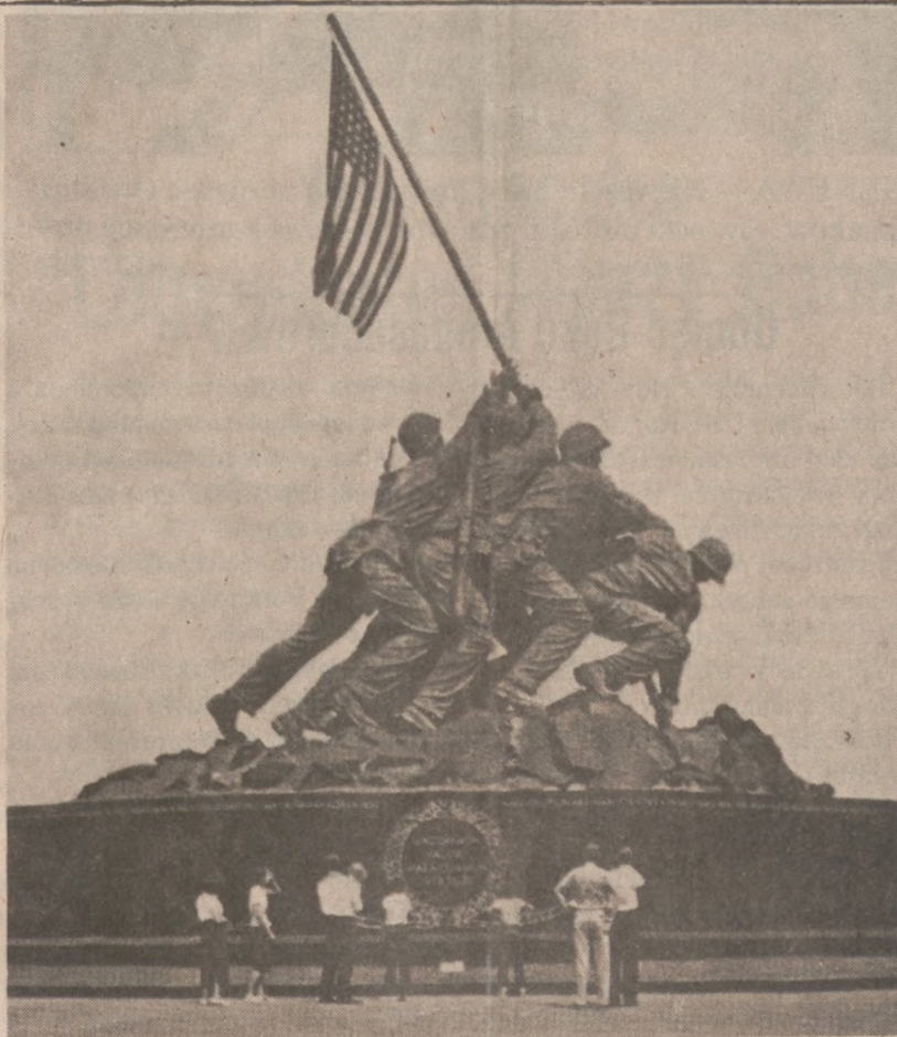
ARLINGTON, VA. — Pomnik bohaterów walk na Iwo Jima.

Z informacji uzyskanych przez "Bild" wynika, że spośród 23 libijskich dyplomatów, którym władze RFN nakazały opuszczenie kraju, jedenastu w dalszym ciągu przebywa w Niemczech Zachodnich, dwóch zaś "zeszło do podziemia".