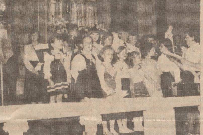
Dzieci i młodzież Rycerzy Niepokalanej w czasie niedzielnej uroczystości.