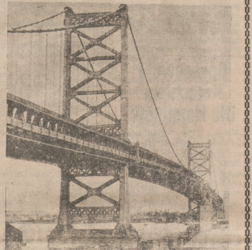
30 Most Benjamina Franklina w Filadelfii

„Robotnicy potrafią poznać »Big Bossa« na takich robotach jak Delaware Bridge. I gdy »Big Boss« jest tak, jak Ralph Modjeski — staje się ich ulubieńcem. Od najbliższej