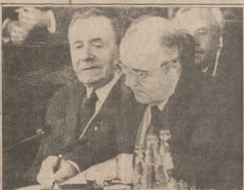
BUDAPESZT — Michaił Gorbaczow podpisuje tekst propozycji dotyczącej zredukowania sił zbrojnych, jaką przygotowali członkowie Paktu Warszawskiego. Obok Gorbaczowa — Andrej Gromyko.

Washington (CT) — Senat sprzeciwił się wszelkim próbom utrzymania obecnego statusu kont Indywidualnego Funduszu Emerytalnego (IRA). Propozycja reformy podatkowej przedstawionej przez Senat dopuszcza wykluczenie spod opodatkowania tylko wkładów na konta IRA, należących do pracowników, którzy nie są objęci innym funduszem emerytalnym. Spodziewane jest, że Izba Reprezentantów sprzeciwi się opodatkowaniu wkładów na kontach IRA. Konta te posiada 28 mln osób. Prezydent Reagan chciałby, aby ustawa o reformie podatkowej została zatwierdzona bez poprawek. Sen. Robert Packwood, przewodniczący Komitetu Finansów powiedział, że wygląda na to, iż "ustawa przejdzie w swojej oryginalnej formie". Utrzymanie statusu IRA pozbawiłoby skarb państwa $26 mld w ciągu pięcioletniego okresu czasu. Debata w sprawie IRA trwała w Senacie cztery dni. Głównym zwolennikiem utrzymania statusu IRA byli senatorzy Alfonse D'Amato (R. — N.Y.) i Christopher Dodd (D. — Conn.). Decyzja Senatu uniemożliwiła inne próby uratowania IRA.