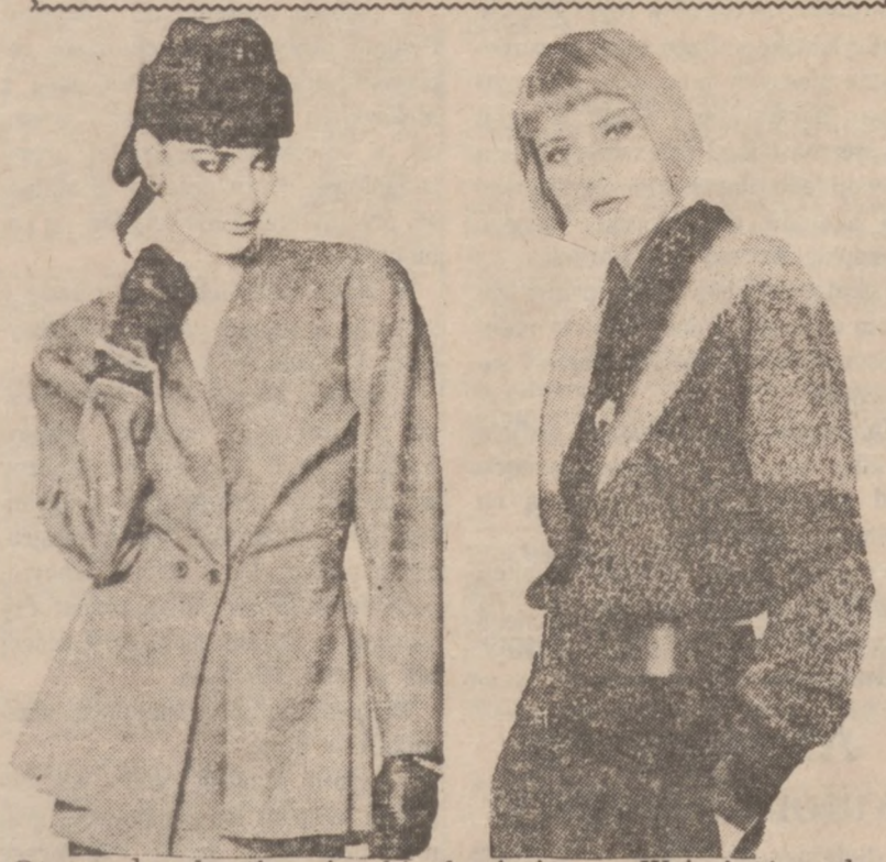
Oto modny kostium i sukienka jesienna. W jesieni modny będzie kolor popielaty.