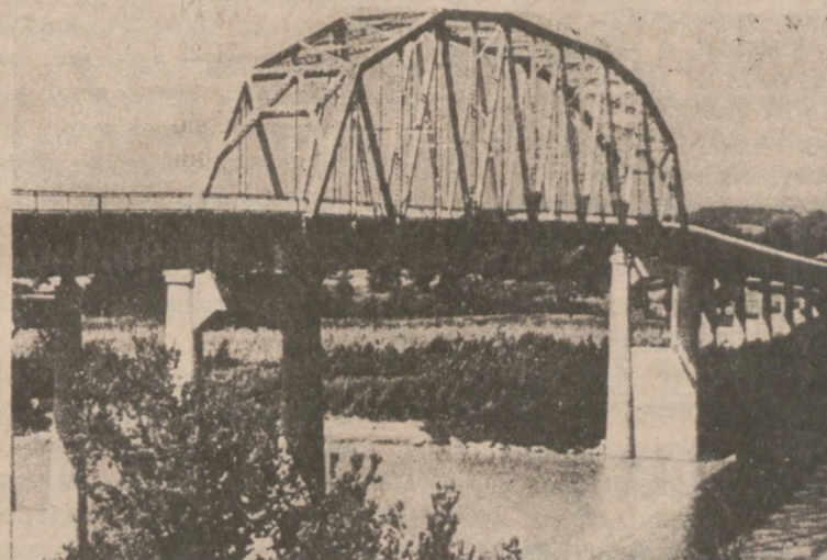
40. Most przez rzekę Tennessee w Paducah (Kentucky)

Doświadczenia i autorytet zdobyty w czasie tej pracy pozwolił firmie „Modjeski and Masters” wybudować dwadzieścia lat później (w roku 1958) w Nowym Orleanie jeszcze jeden most przez Missisipi (Greater New Orleans Bridge). Jest pięknie wydana książka przez firmę „Modjeski and Masters”, która ilustruje prowadzone studia nad tym problemem. Analizowano koncepcje mostu wspornikowego, mostu wiszącego i mostu wantowego. Zwyciężył jeszcze raz — ale była to jedna z ostatnich takich decyzji — most kratownicowy. Rozpiętość głównego przęsła tego mostu była niewiele mniejsza niż w słynnym moście Quebec. Na liście największych mostów tego typu zajmował on przez kilkanaście lat pozycję trzecią, a obecnie, po wybudowaniu w roku 1972 mostu Chester przez rzekę Delaware w Pensylwanii i South Port Bridge w Osaka, przesunął się na miejsce piąte.