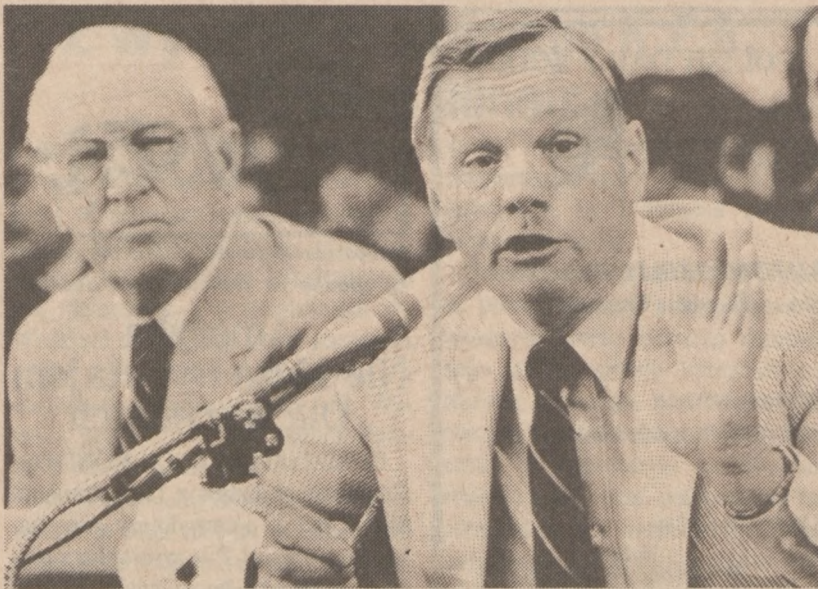
WASHINGTON — Neil Armstrong, wiceprzewodniczący Komisji Rogersa, podczas przesłuchania przed Izbowym Komitetem Wiedzy i Technologii. Dyskusja dotyczyła opublikowanego ostatnio raportu Komisji.

W programie wiele atrakcji Blizszych informacji: 934-3535, po angielsku.