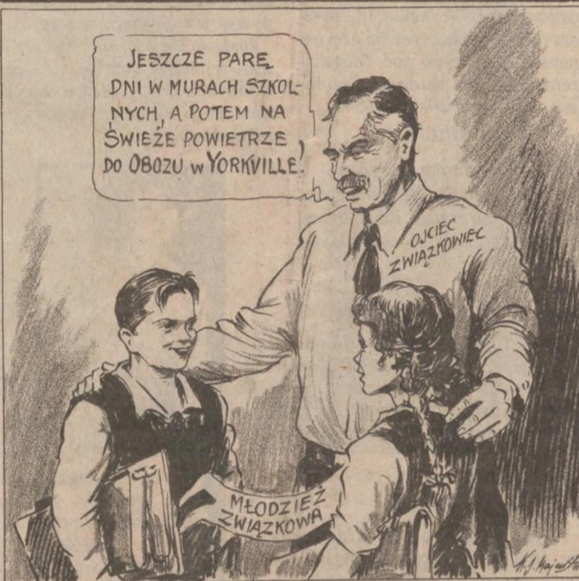
Rok szkolny w większości szkół na terenie metropolii chicagowskiej już się skończył. Zapraszamy dzieci i młodzież na obozy. Rysunek Kazimierza Majewskiego.

Ofiary tragedii nie zostały wydobyte przed nocą z miejsca wypadku ze względu na trudności z wyjęciem ich z wciąż gorących aluminiowych kadłubów. Wśród ofiar wypadku znajdowało się wielu turystów zagranicznych.