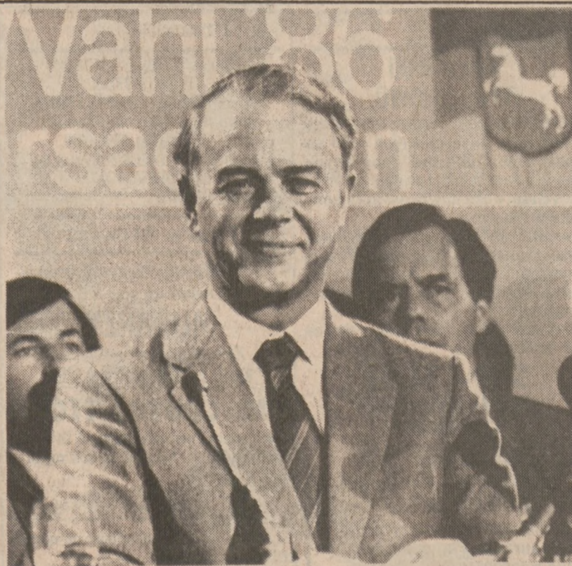
HANOVER, NIEMCY ZACHODNIE. — Ernst Albrecht z zadowoleniem przyjął zwycięstwo swej partii w wyborach jakie się odbyły w połowie czerwca w południowej Saksonii.