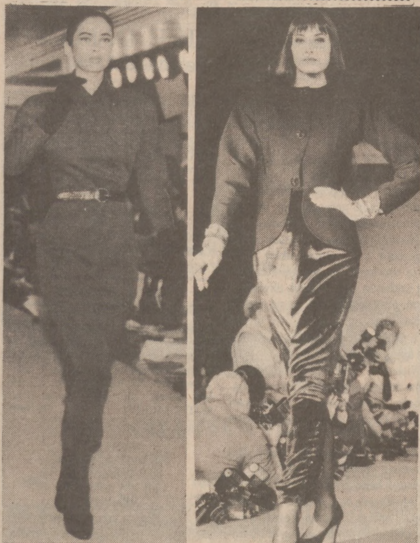
Model Calvina Klein'a, z lewej, długa dżersejowa sukienka, z prawej model Geoffrey'a Beene, czarny wełniany żakiet założony na aksamitną jednoczęściową sukienkę.