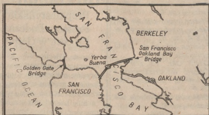
43. Sytuacja Trans-Bay i Golden Gate Bridges

Odnosi się wrażenie, że dopiero w tym drugim, późniejszym okresie zaczyna całościowo panować nad tematem. Bez uszczerbku dla funkcji, konstruuje mosty bardziej jednolite w swej formie, mniej mówiące wielkością, a więcej wyważeniem proporcji. A gdy po roku 1928 American Institute of