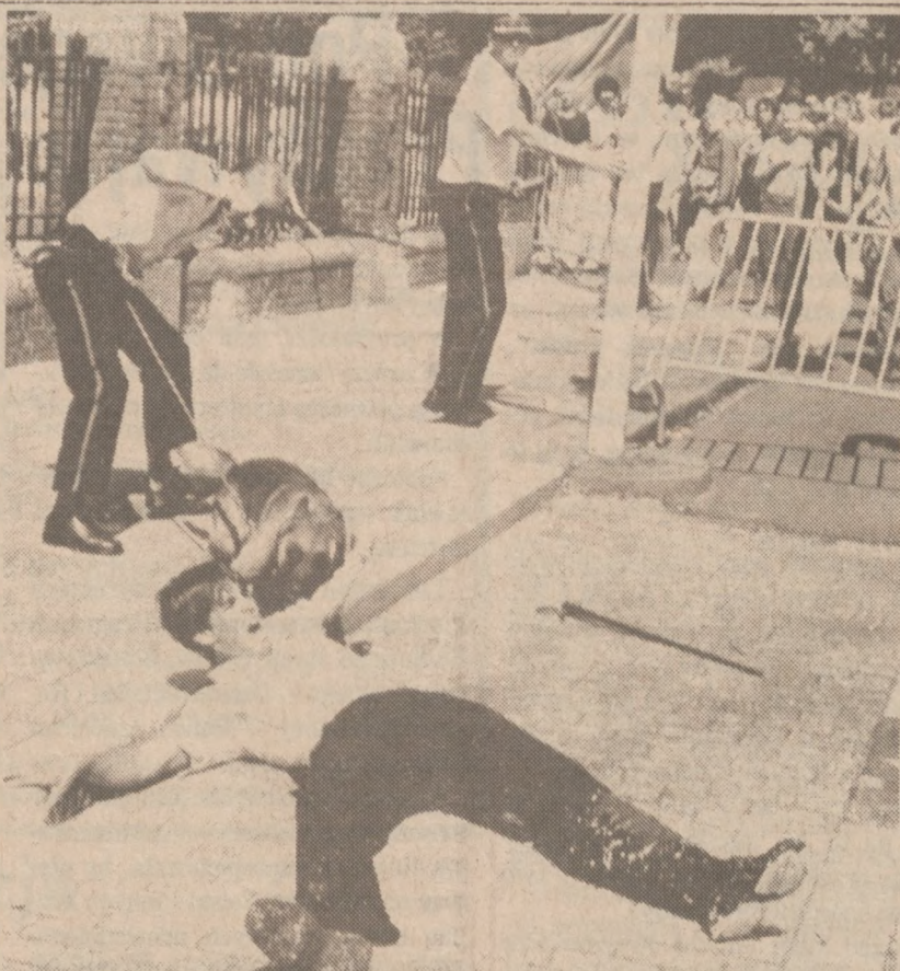
HAGA, HOLANDIA. — W niedzielę, 15 czerwca mieszkańcy Hagi protestowali przed ambasadą Afryki Południowej.

M. Rajawi stoi na czele ludowej organizacji mudżaheddinów, czyli bojowników. Przyleciał on do Bagdadu po pięciu latach życia na uchodźstwie we Francji. W rozmowie z prez. Husseinem powiedział on, że mudżaheddini chcieliby nawiązać dobre stosunki pomiędzy dwoma państwami. Hussein z kolei zapewnił Rajawiego, że Irak z całym szacunkiem odnosi się do reprezentowanego przez niego ugrupowania oraz jego działalności. Podobno zapewnił także, że uważa wszystkich irańskich jeńców wojennych, którzy są rodakami Rajawiego, za gości w Iraku.