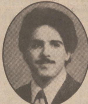
Ray Abdullah Richards H.S.

5086 N. ELSTON Od Wtorku do Soboty: 8 Rano — 4 Po Pol.