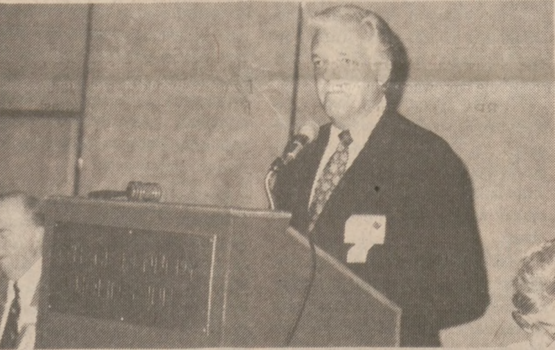
Przewodniczący 54 Sejmu Stanley Kuser.