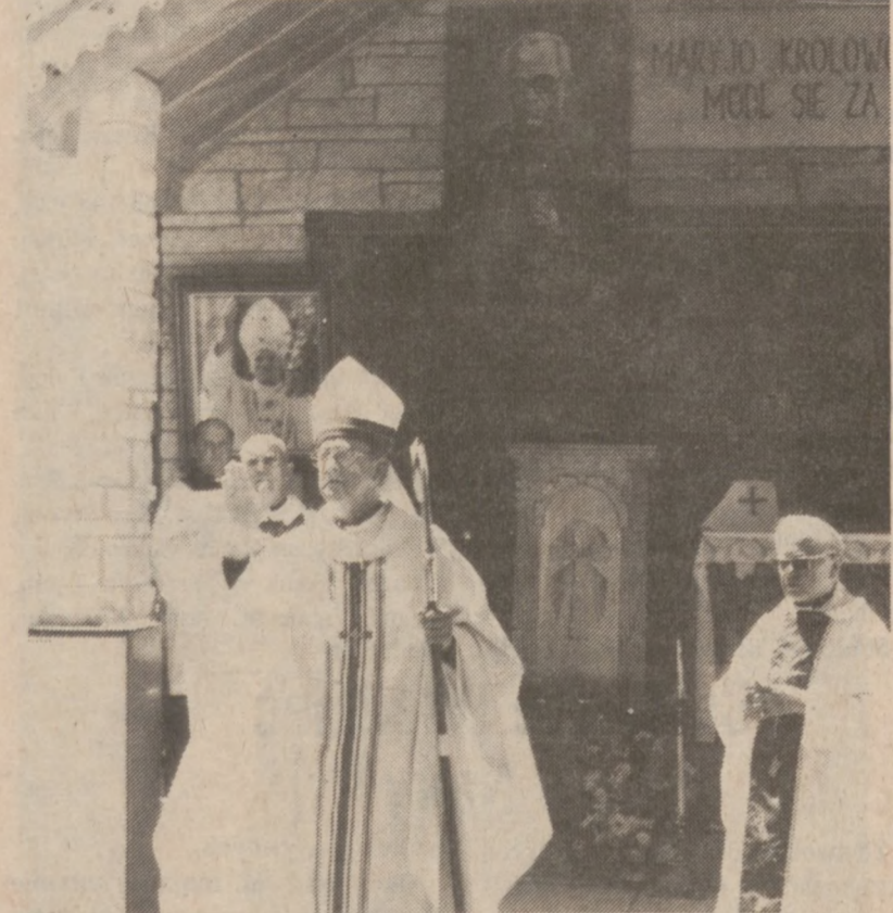
Ks. arcybiskup Rembert G. Weakland udziela błogosławieństwa wiernym.

Specjalne podziękowanie należy się Jego Eksceleencji arcybiskupowi Rembertowi G. Weaklandowi, jako naszemu oddanemu arcybiskupowi. Przybył do swojej owczarni z