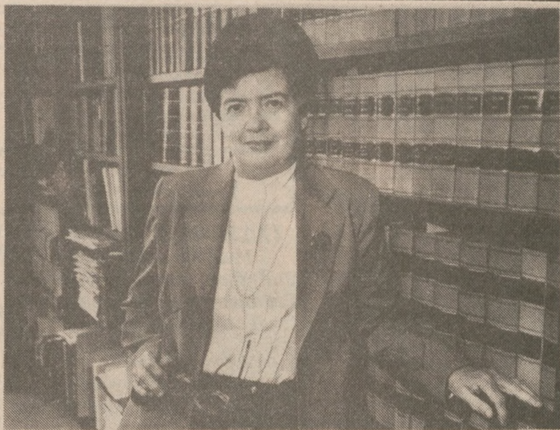
WASHINGTON — Patricia McGowan Wald została mianowana nowym przewodniczącym federalnego sądu apelacyjnego. Pani Wald jest pierwszą w dziejach Stanów Zjednoczonych kobietą zajmującą to stanowisko.