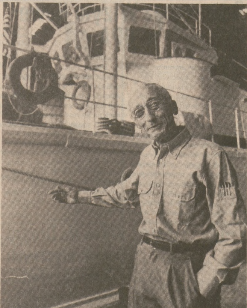
MIAMI, FLA — Znany podróżnik i badacz Jacques Cousteau przed statkiem badawczym "Calypso" którym wyruszy niebawem w podróż dookoła świata.

Obecnie trwają dyskusje w Kongresie mające na celu przekonanie dostatecznej liczby ustawodawców o konieczności ograniczenia importu towarów tekstylnych, czyli zdobycia dostatecznej liczby głosów dla obalenia weta prezydenckiego.