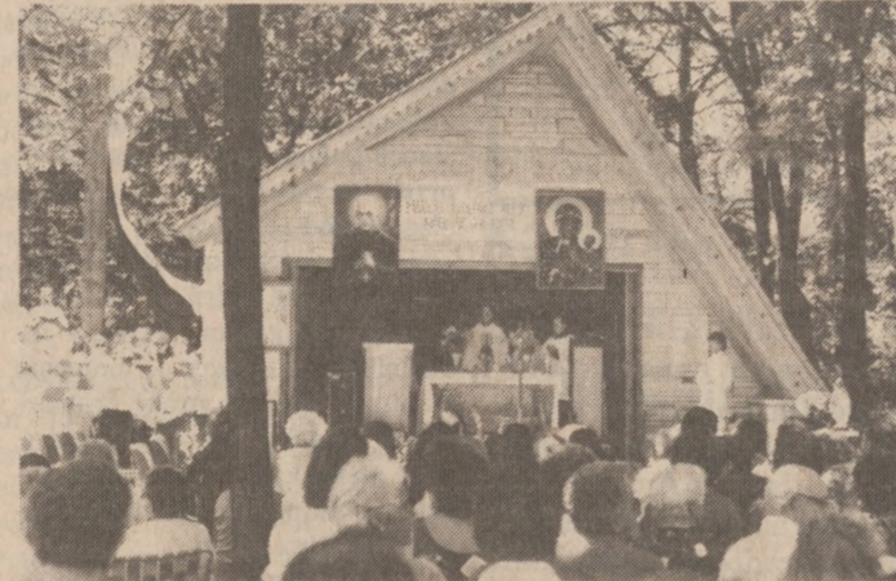
Msza św. w nowo poświęconej kaplicy. Na lewo chór "Nowe Życie."