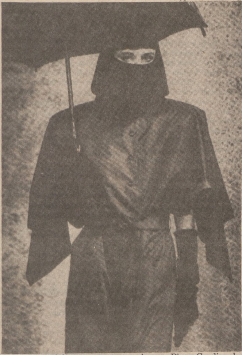
Jednym z modeli, zaprezentowanych przez Pierre Cardina, był ten płaszcz przeciwdeszczowy, jakby wymarzony dla potencjalnych terrorystek. W modzie już jesień.