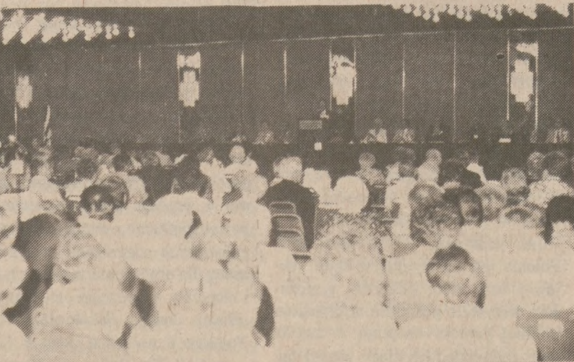
Sala obrad 54 Sejmu Zjednoczenia Polskiego Rzymsko-Katolickiego w Ameryce.