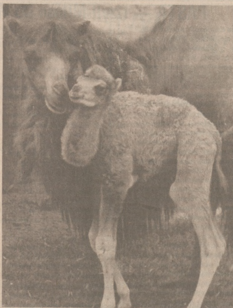
CHICAGO — Wielbłądzica Cashmere, mieszkanka Lincoln Park Zoo, urodziła 26 lipca takie oto pocieszne maleństwo, które wciąż jeszcze niepewnie trzyma się na nogach i nie odzuwa najmniejszej ochoty posiadaniu garbu.

Robert Tisch jest rodowitym nowojorczykiem i ukończył wydział ekonomii na Uniwersytecie Michigan. Jego roczna pensja na nowym stanowisku wynosić będzie $86,200.