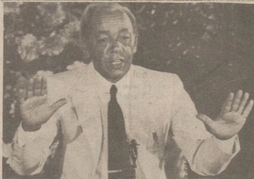
RABAT, MAROKO — Król Hassan II zrezygnował 23 lipca z godności przewodniczącego Ligi Arabskiej. Powodem były niewybredne ataki niektórych państw arabskich po spotkaniu Hassana z Peresem.