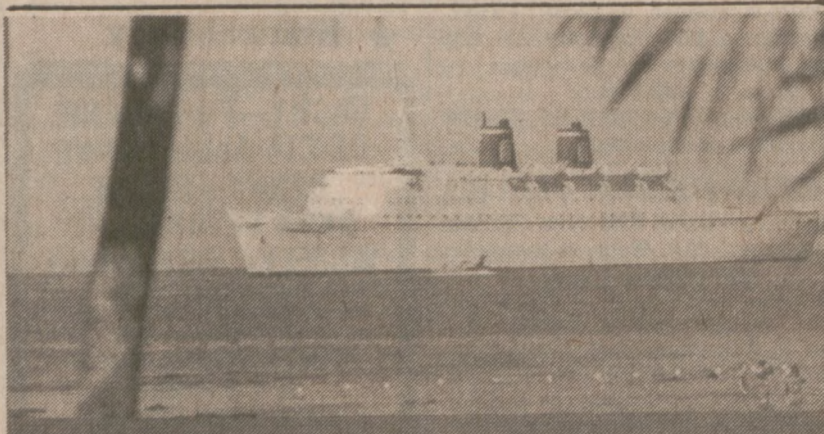
MIAMI — Wycieczkowiec s/s "Emerald Sea" padł ofiarą pożaru. Ogień stłumiono, ale 4 członków załogi odniosło rany, zaś pasażerów ewakuowano.