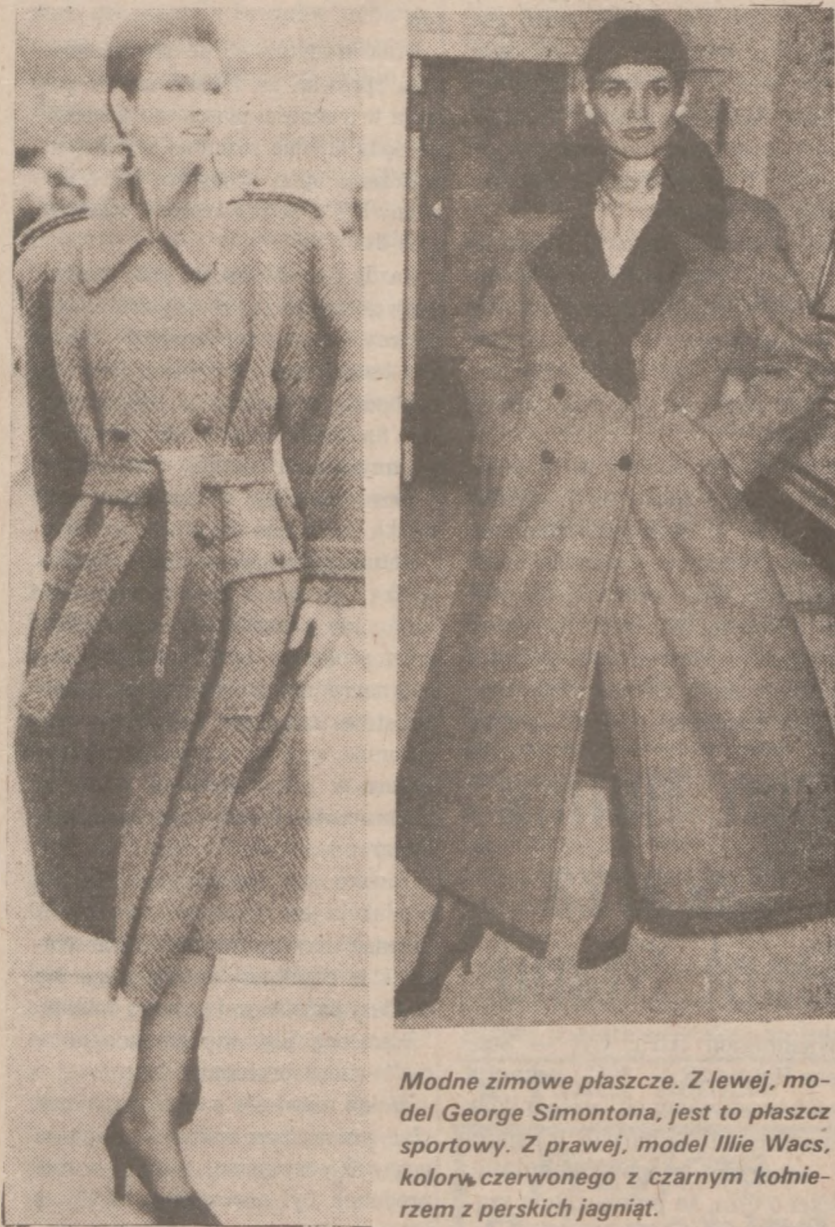
Modne zimowe płaszcze. Z lewej, model George Simontona, jest to płaszcz sportowy. Z prawej, model Illie Wacs, koloru czerwonego z czarnym kołnierzem z perskich jagniąt.