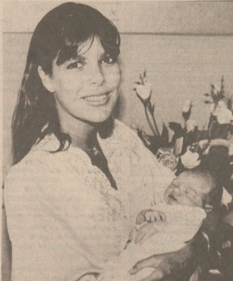
MONAKO — Oto pierwsze zdjęcie księżniczki Karoliny i jej córeczki, Charlotty, urodzonej 3 sierpnia. Pocięta ważyła 3,100 g.

Prezydent zakończył swoje przemówienie przyrzeczeniem wyprawienia amerykańskiego rolnictwa z kryzysu.