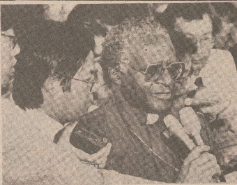
HIROSZIMA — W 41 rocznicę wybuchu bomby atomowej zrzuconej na to japońskie miasto rozpoczęła się głośno rozkłamawana "konferencja pokojowa". Przybył na nią — m.in. — bp. Desmond Tutu.