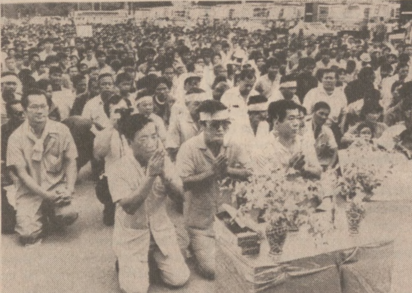
BANGKOK — Około 2,000 zwolenników gen. Perma Tinsulanondy zebrało się 5 sierpnia pod pomnikiem króla Chulalongkoma w Centrum stolicy Tajlandii. Generał został desygnowany na nowego premiera rządu tego południowoazjatyckiego kraju. (Reuter)

W kronice żałobnej należy odnotować odejście z szeregu delegatów Wydziału śp. Jana Grabowskiego, który zmarł nagle na atak serca, biorąc udział w zlocie młodzieży ZNP