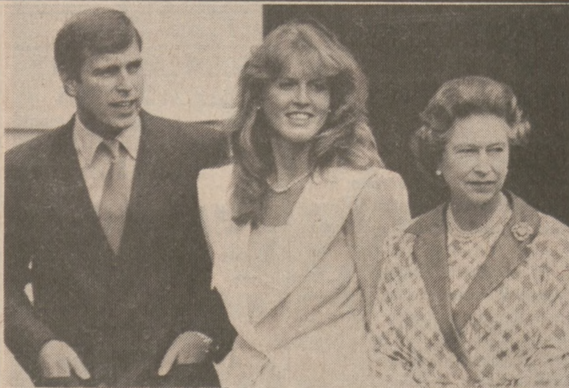
LONDYN — Księżę i księżna Yorku już zakończyli swą poślubną podróż, bowiem oczekiwała ich nie była jaka uroczystość — 86 urodziny Królowej Matki.