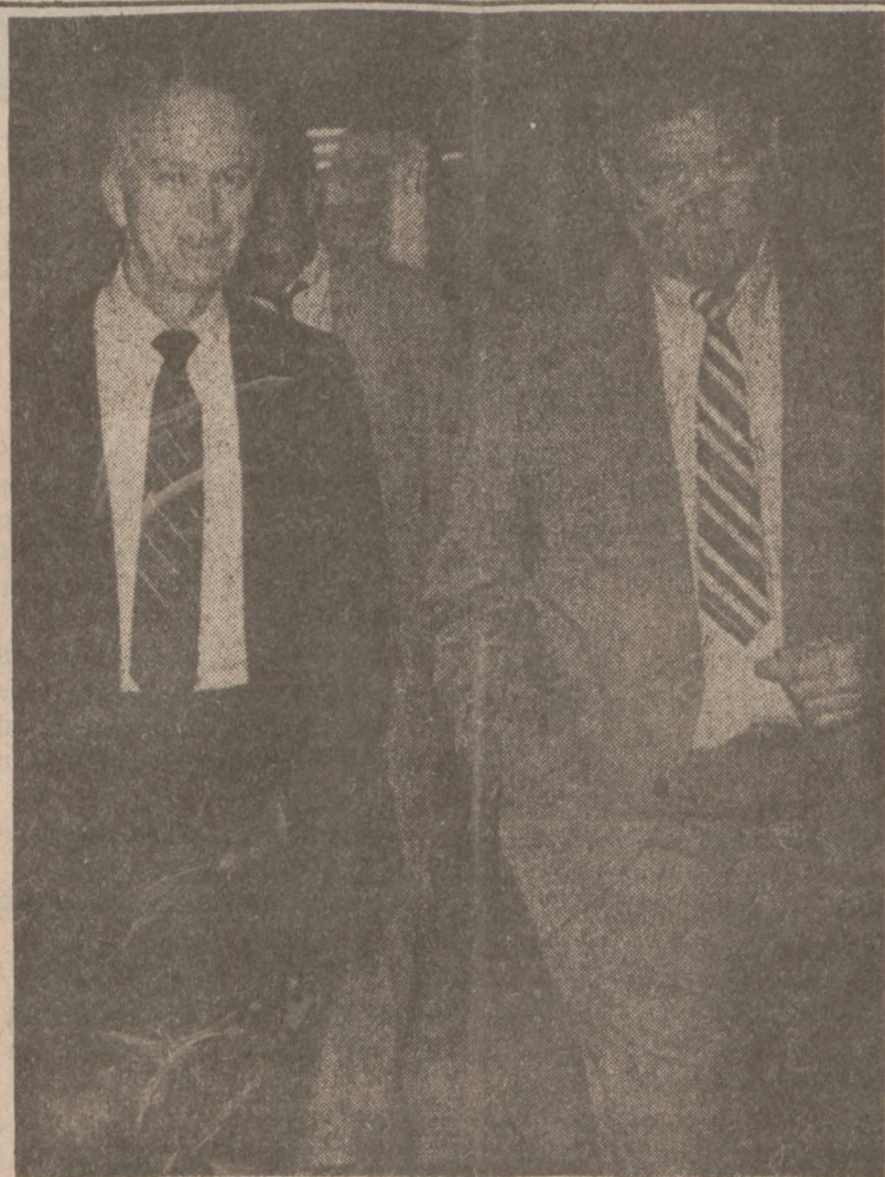
WASHINGTON — Senator Bob Packwood i kongr. Dan Rostenkowski — przewodniczący komitetu w którego skład wchodzi przedstawiciele obu izb Kongresu po całonocnej sesji w czasie której zakończono ustalanie szczegółów reformy podatkowej.

Rząd sudański planuje nową ofensywę przeciwko rebeliantom. Obserwatorzy twierdzą, że po stronie wojsk rządowych ma wziąć udział ponad 13,000 żołnierzy libijskich. Rząd Libii już do dłuższego czasu udziela ekonomicznej i politycznej pomocy dla ubogiego Sudanu, a teraz postanowił wysłać też swoje wojska, by wspomóc armię sudańską w akcjach przeciw partyzantom.