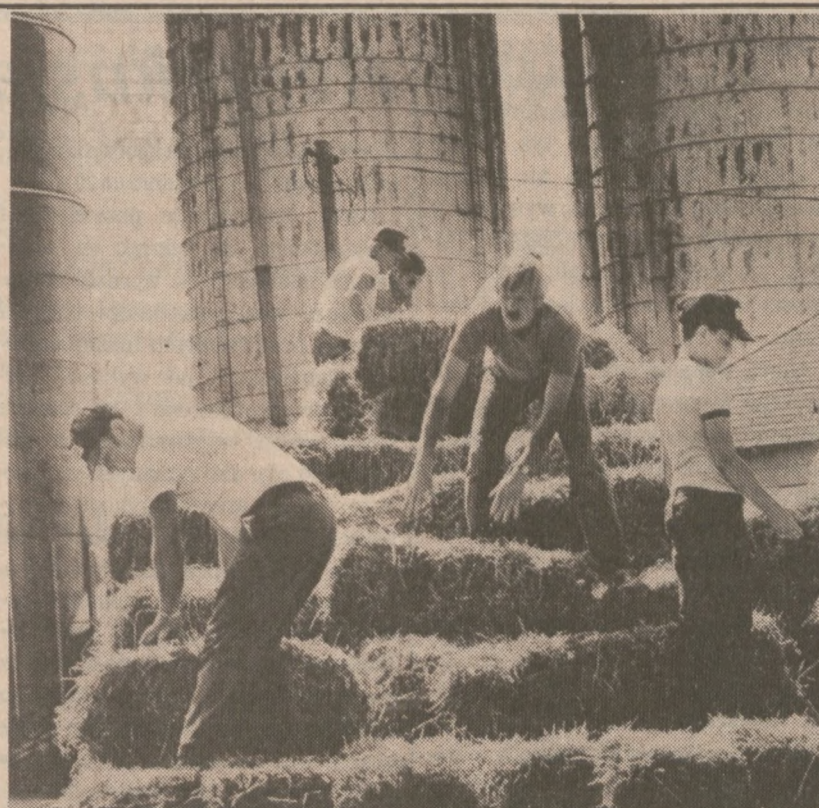
BLAIRSTOWN, N.J. — Pomoc dla Południa. Farmerzy z New Jersey ładują siano, które być może przyniesie ratunek krowom z Karoliny Południowej.

Tygodnik podaje, że rząd postanowił przeznaczyć na ten cel w nadchodzącym roku fiskalnym 150 mln dol. Całkowity koszt budowy wahadłowca oszacowano na 2 mld dol.