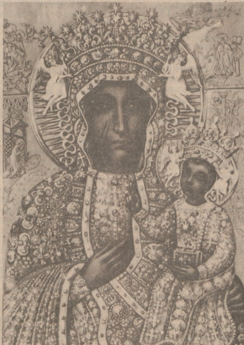
Matka Boska Częstochowska — Królowa Polski.

Cudowna obrona Jasnej Góry w czasie potopu szwedzkiego, jak