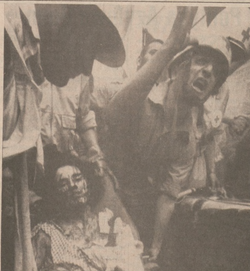
BEJRUT — Droga dla rannej! Kolejny zamach bombowy w Libanie kosztował ten niewielki kraj 40 rannych i 15 zabitych.

Do banku powędrowało 16 mln, 16,5 mln pochłonęły koszty organizacyjne. Organizatorzy wciąż mają nadzieję, że uda im się zebrać 20 mln dol. Starają się skontaktować z osobami, które obiecały nadesłać pieniądze, ale tego nie uczyniły.