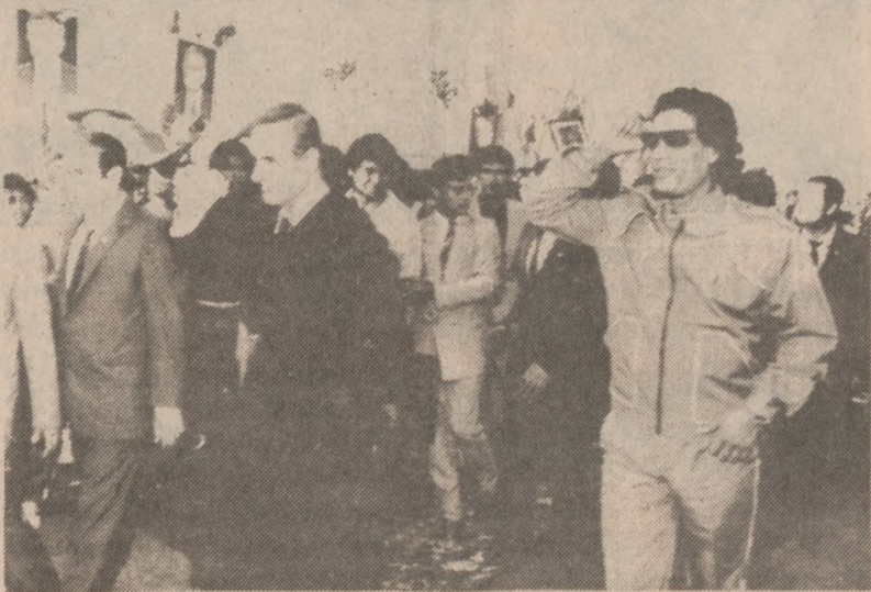
BENGAZI, LIBIA. — Płk. Kadafi osobiście przywitał na lotnisku prezydenta Syrii Hafeza AlAssada, który przybył tu z wizytą 26 sierpnia br.

Sowieci mają też inny sposób na obrócenie cennych urządzeń programu SDI w bezużyteczny złom. Może temu służyć np. “zarzucenie” urządzeń SDI ogromną ilością tanich rakiet co będzie Moskwę kosztowało nie więcej niż 1 do 2% tego, co Amerykanie poświęcają na SDI.