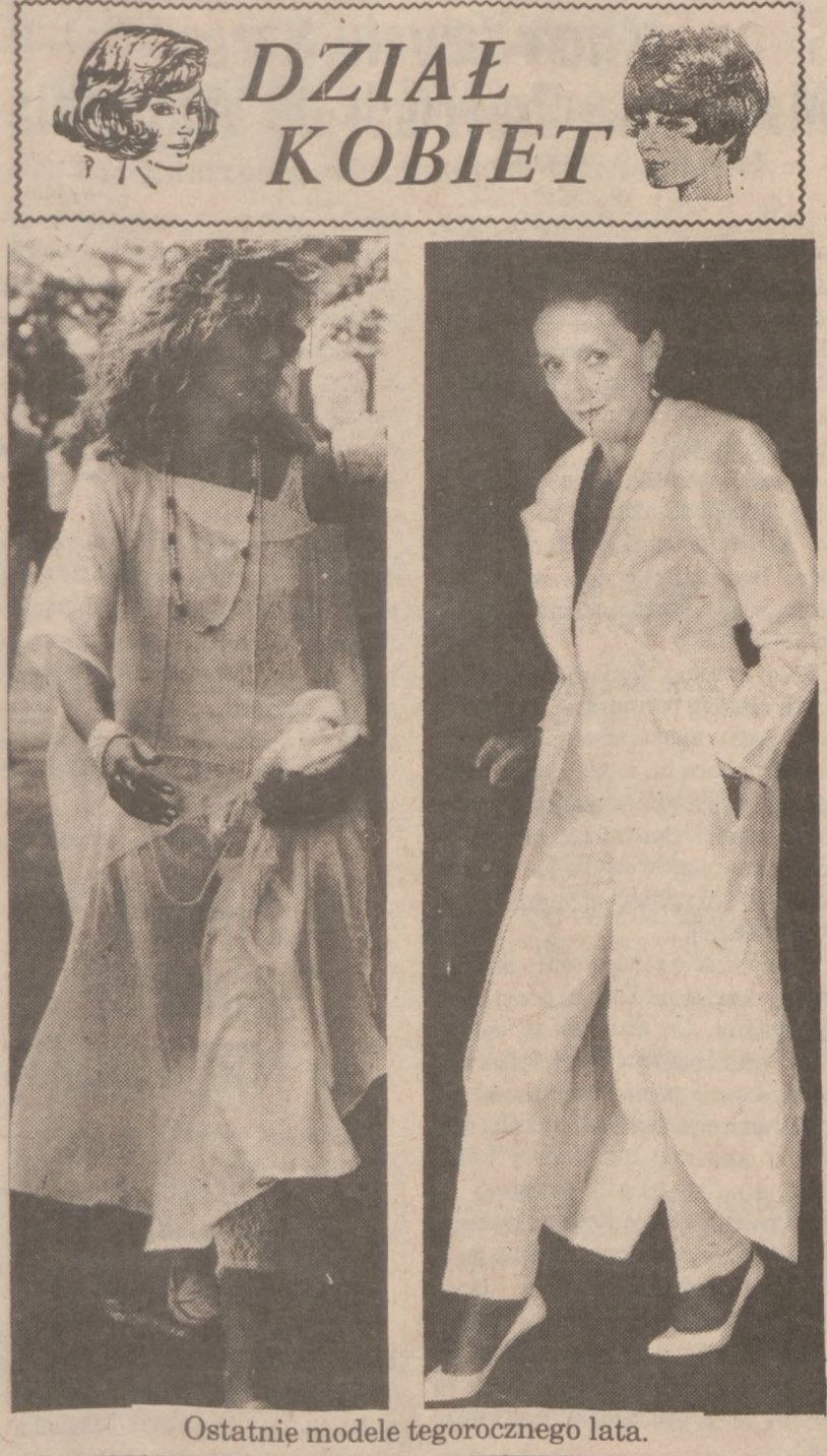
Ostatnie modele tegorocznego lata.