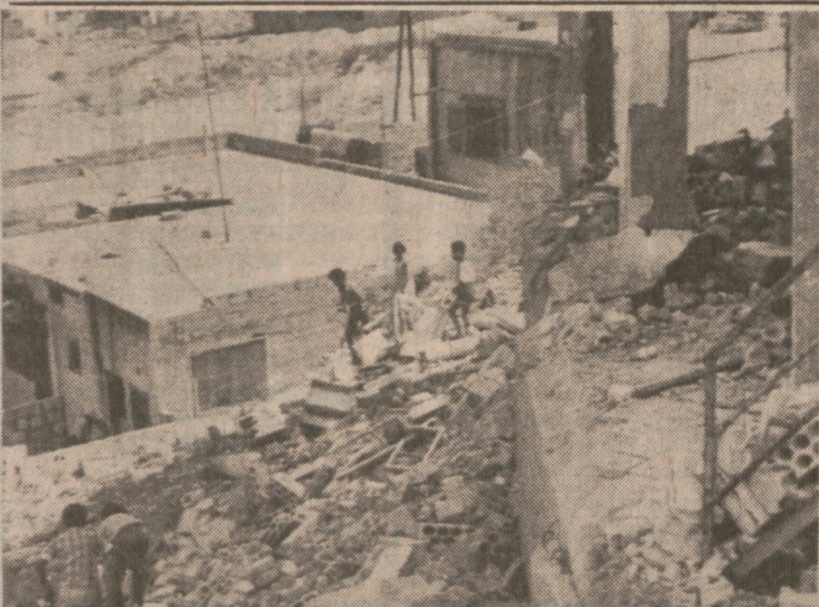
SAJDA, P.L.D. LIBAN — Gruzji palestyńskiego obozu Ain-El-Hilweh pod Sajdą. 10 osób odniosło rany podczas bombardowania dokonanego przez izraelskie helikoptery.

Po przyjeździe dziecka do szkoły Academy of Our Lady, przy 1309 W. 95th St., zawiadomiono policję. Policja prowadzi poszukiwania sprawcy przestępstwa.