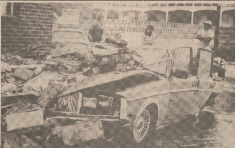
NAGS HEAD, N.C. — Z szybkością 75 mil/godz. uderzył huragan Charlie w wybrzeże Karoliny Północnej. Zwalony mur przysięgnięty stojący na parkingu nowiutki samochód.