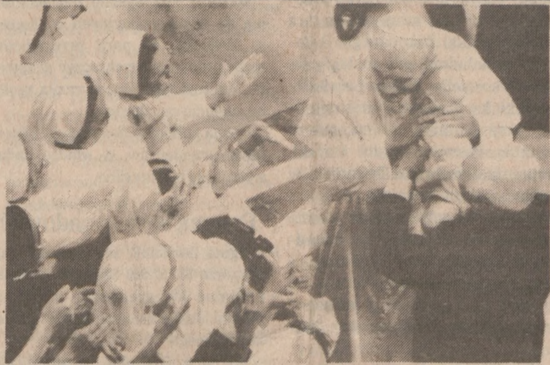
WATYKAN — Ojciec Święty Jan Paweł II w czasie jednej z audiencji na Placu Świętego Piotra.

Doniesienia nie wymieniają z nazwy drugiego statku sowieckiego.