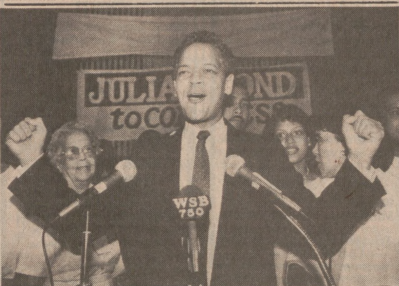
ATLANTA — Senator i znany obrońca praw obywatelskich Julian Bond w chwilę po uzyskaniu informacji, że prowadzi ze znaczną przewagą na Johnem Lewisem w prawyborach demokratycznych 5 okręgu.

Ponadto okręg 209 w Proviso Township oraz Oakton Community College w Des Plaines złożyły formalne zawiadomienie o zamiarze rozpoczęcia strajku, prowadzone są jednak zajęcia szkolne bez nowego kontraktu.