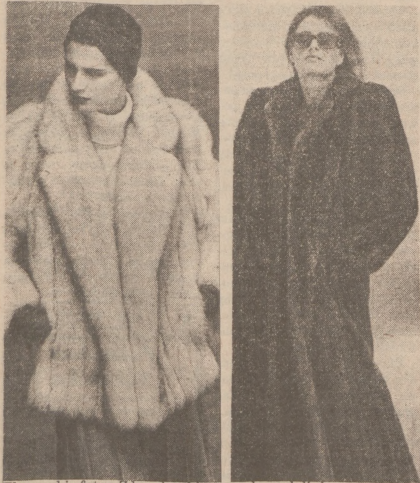
Eleganckie futra. Z lewej, zakiet ze srebrnych lisów, z prawej, płaszcz z norek.