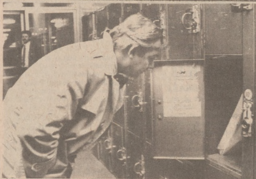
MELBOURNE, AUSTRALIA — W tej skrytce bagażowej na dworcu w Melbourne odnaleziono nieuszkodzone dzieło Picasa z roku 1937 "Płacząca kobieta." O miejscu przechowywania skradzionego 16 dni wcześniej obrazu poinformował policję niezidentyfikowany świadek kradzieży.