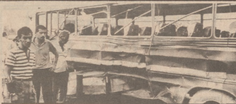
BEJRUT — Bomba w torbie podróżnej. Tym razem ranionych zostało jedynie trzech pasażerów autobusu, ale tydzień wcześniej wybuch zabił 20, raniał zaś 100 osób.