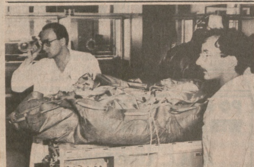
PARYŻ, FRANCJA. — Ewakuacja rannych z kwatery policji, gdzie wybuchła bomba raniąc 52 osoby.

W procesie wzięli udział eksperci do identyfikacji głosu. Wiele nagranych rozmów przesłuchano podczas rozprawy i eksperci jednoznacznie stwierdzili, że badania sektogramu wykazały, że nagrane głosy należą do obu oskarżonych. Opinie ekspertów w połączeniu z innymi dowodami doprowadziły do uznania siostr winnymi zarzucanych im przestępstw. Nie podano jeszcze daty ogłoszenia wyroku.