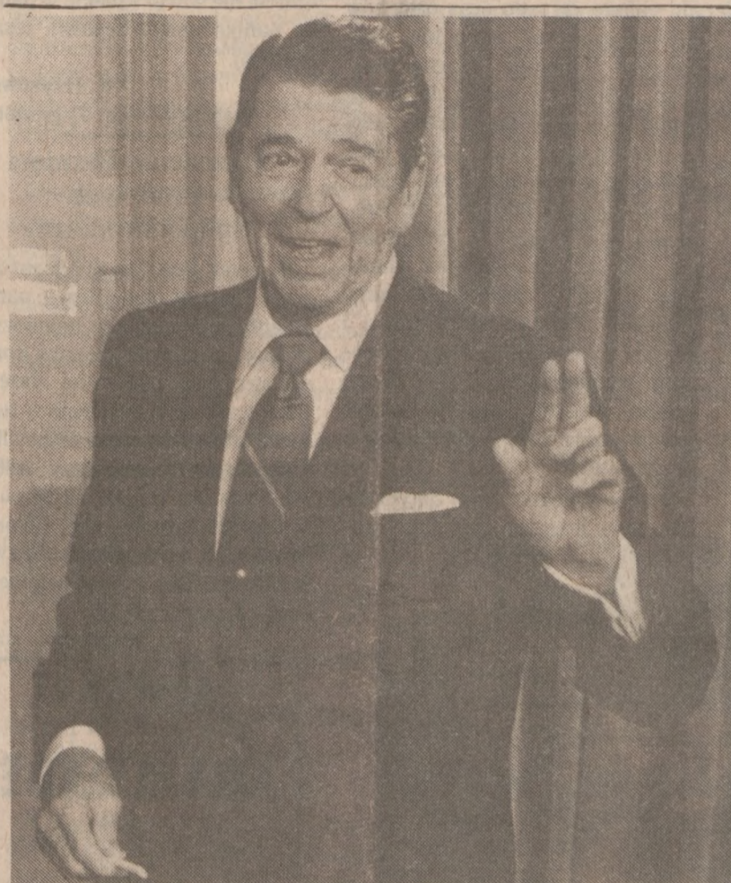
WASHINGTON — Prezydent Reagan po konferencji prasowej w czasie której podał do wiadomości o planowanym spotkaniu z Gorbaczowem jakie odbędzie się 11 i 12 października w Islandii.

"Uważamy — powiedział sen. John Warner, R.-Va. — że akcje powinny prowadzić nieumundurowany personel, nie posiadający takich uprawnień do aresztowania..." Senatorom chodzi głównie o to, że 45-dniowy termin zastopowania napływu narkotyków do Stanów Zjednoczonych jest nierealny, a ponadto użycie armii wydaje się bezpodstawne.