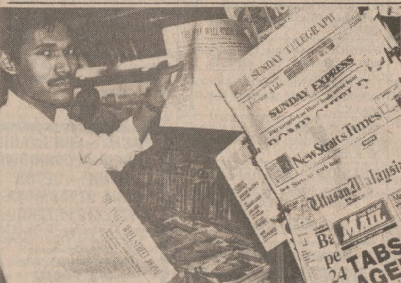
KUALA LAMPUR, MALEZJA. — Sprzedawca gazet zabiera z kiosku azjatyckie wydanie "The Wall Street Journal". Rząd malezyjski zakazał sprzedaż tego pisma przez następne trzy miesiące.