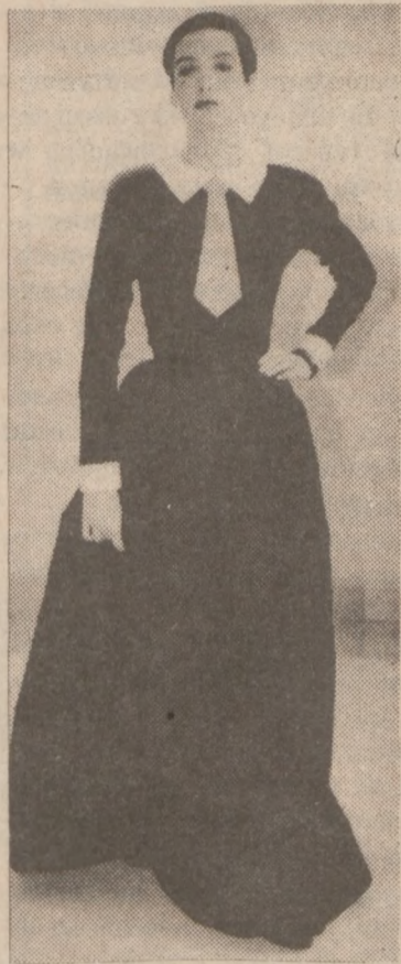
Modne sukienki wieczorowe.