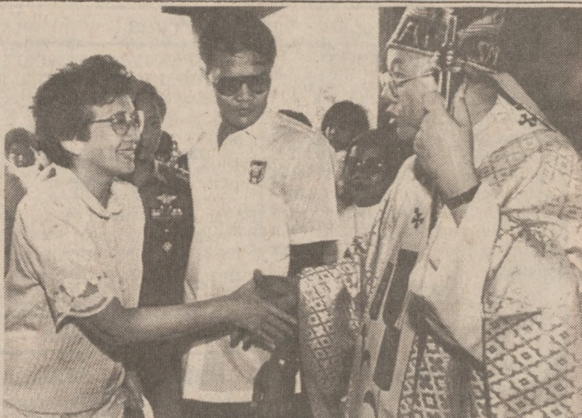
MANILA, FILIPINY. — Prezydent Manili Corason Aquino wita się z kardynałem Jaime Sin, przed Mszą św. dziękczynną odprowioną przez Kardynała w podzięce za szczęśliwy powrót Prezydenta z podróży do U.S.