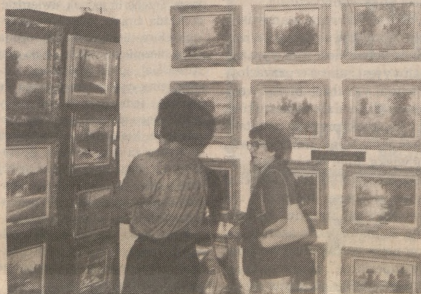
Fragment wystawy trzech malarzy w Morgan Art Gallery.

Krytycy piszą, że jest on jednym z najbardziej znanych marynistów, nie tylko w Ameryce, ale także w