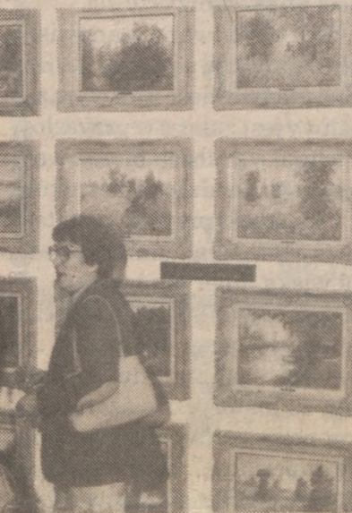
Fragment wystawy trzech malarzy w Morgan Art Gallery.