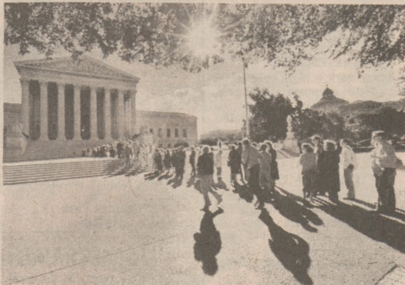
WASHINGTON — Zainteresowani przebiegiem obrad Sądu Najwyższego Stanów Zjednoczonych czekają przed gmachem sądowym na możliwość wejścia na salę. Sesja Sądu Najwyższego na 1986-87 rozpoczęła się 6 października.

Sprawy mogą się skomplikować jeśli wybory wygra Stevenson, który zapowiedział, że woli być zaprzysiężony (tzn. jeśli wygra wybory) w Illinois State Armory tzn. tam gdzie odbywały się dwie pierwsze inauguracje Thompsona. W odpowiedzi na oświadczenie Stevensona, Thompson powiedział, że nie interesują go takie szczegóły. "Jeśli wygra może zorganizować to (zaprzysiężenie) w zbrojowni, ale najpierw musi wygrać" — stwierdził Gubernator.