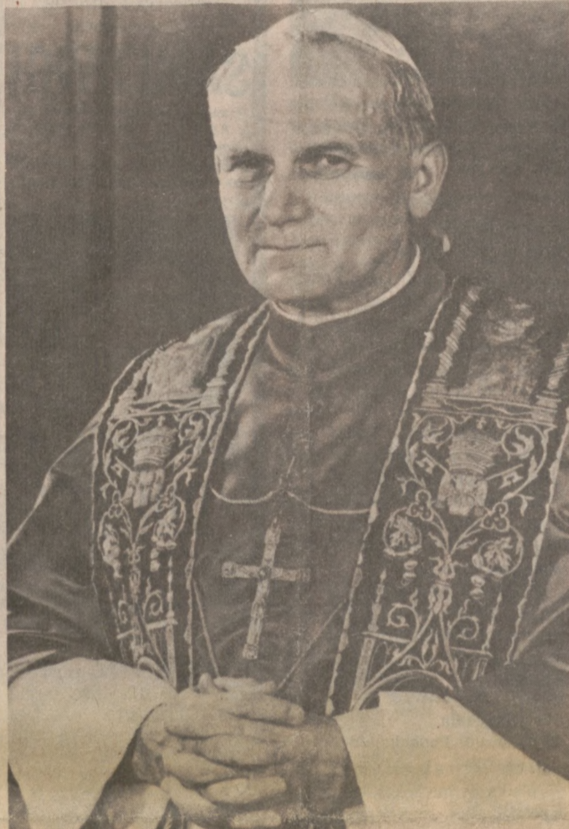
Dzisiaj mija rocznica wyniesienia Kardynała Karola Wojtyły na Stolicę Piotrową. (16 października, 1978 r.)