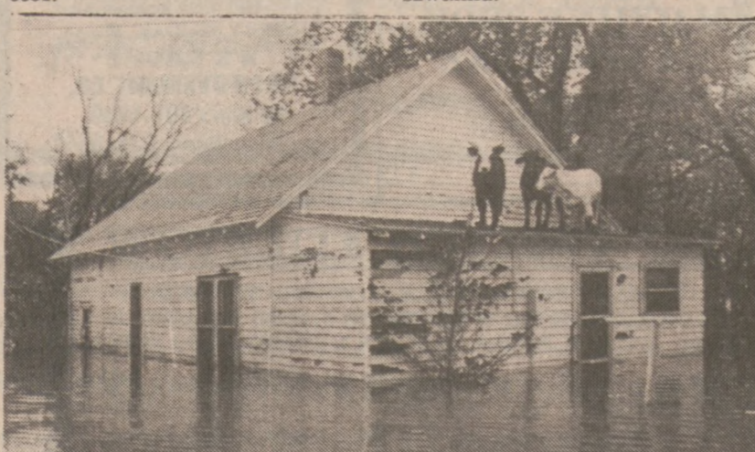
MANHATTAN, KANS. — Krowy znalazły schronienie przed powodzią na dachu jednego z domów. Później, kiedy poziom wody opadł, krowy pozostały na dachu, było bowiem zbyt wysoko by mogły zeskokoczyć.