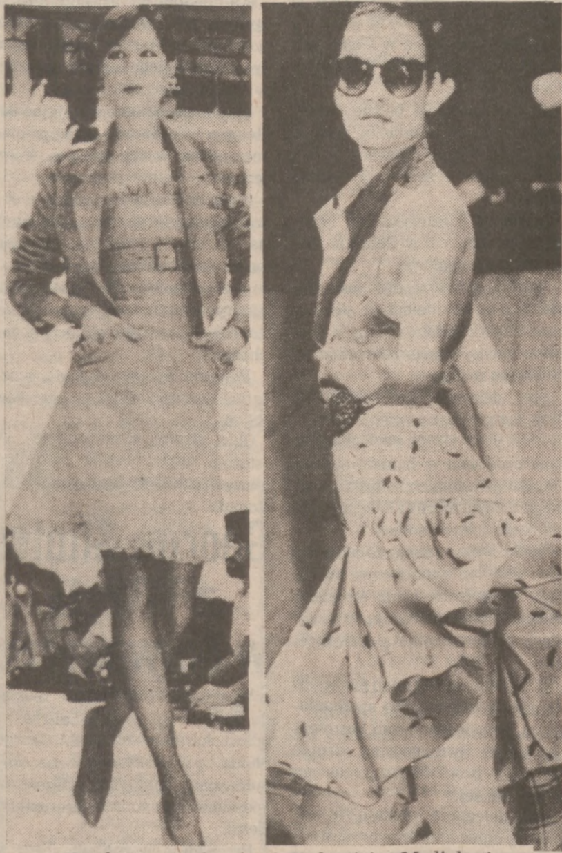
Z pokazów mody wiosenno-lętnej w Mediolanie.