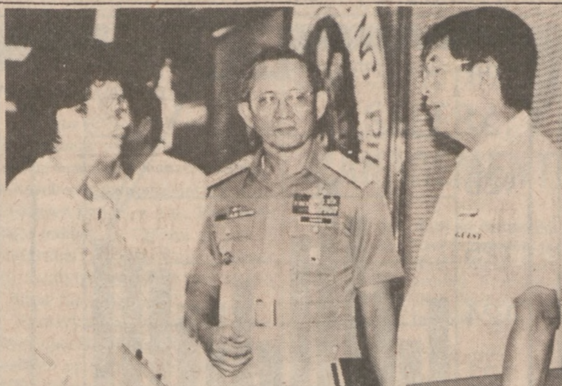
MANILA — Prezydent Corazon Aquino rozmawia z ministrem obrony Juanem Ponce Enrile podczas spotkania w sprawie muzulmańskich rebeliantów, działających w południowej części Filipin. W środku szef sił zbrojnych Fidel Ramos.

Wydaje się, że Belgowie — gdyby chcieli — mogli osiągnąć znacznie korzystniejszy rezultat.