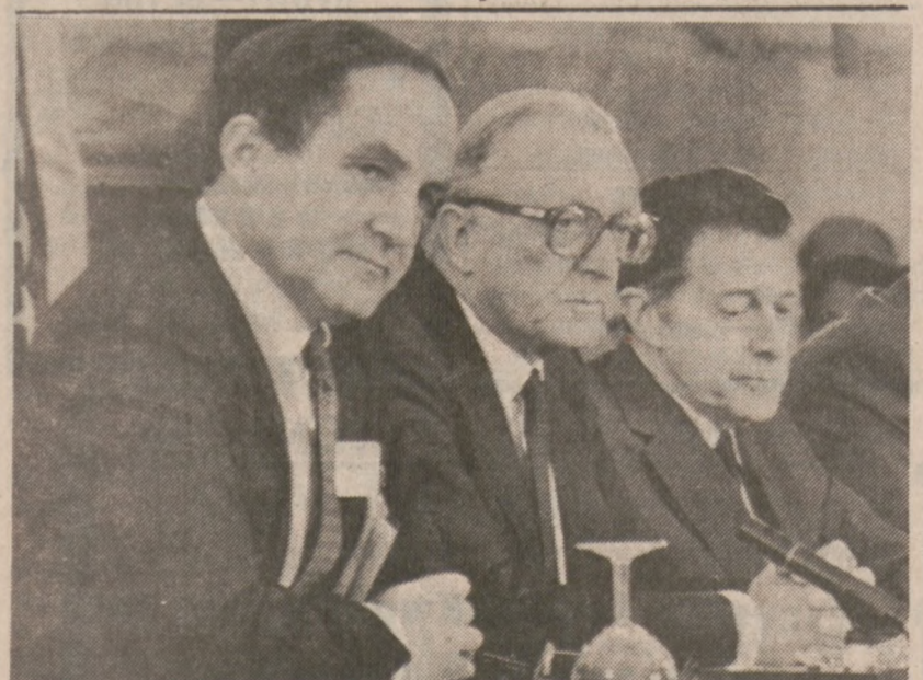
GLENEAGLES — Spotkanie przedstawicieli państw NATO. Brytyjski minister obrony George Younger, sekretarz generalny paktu Lord Carrington oraz sekretarz obrony USA, Caspar Weinberger.