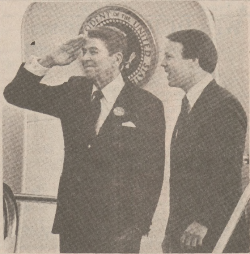
OKLAHOMA CITY — Prezydent Reagan podczas wizyty w bazie lotnictwa.

Zarząd CPL obiecał, że ostateczna decyzja zostanie podjęta do 10 listopada.