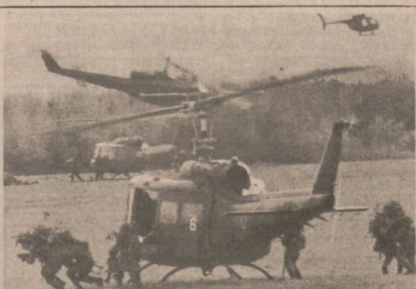
CHITOSE — Manewry na japońskiej wyspie Hokkaido. Na zdjęciu widoczne śmigłowce HU-1 i żołnierze wojsk desantowych.