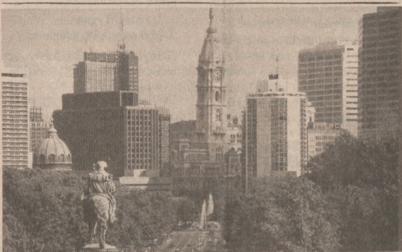
FILADELFA — Panorama miasta ze stopni Muzeum Sztuki. W centrum Ratusz Miejski ze słynną statua Peter'a Penn'a.