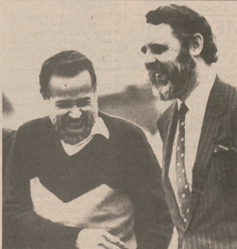
WIESBADEN — David Jacobsen i Terry Waite po przylocie do RFN z Cypru. Jacobsen został uwolniony przez Dżihad 2 listopada br.