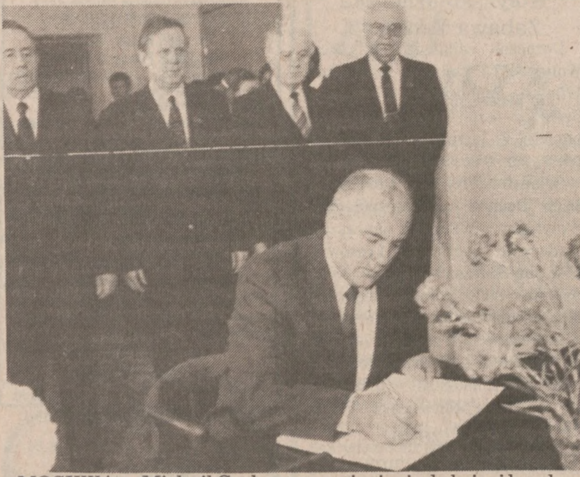
MOSKWA — Michaił Gorbaczow wpisuje się do książki kondolencyjnej w ambasadzie Mozambiku, po śmierci prezydenta Samora Macheli.

Rzecznik sowieckiego MSZ Genady Gerasimow uzupełnił wczoraj wypowiedź swego ministra twierdząc, że poczynając od 1 stycznia 1987 roku urzędy sowieckie będą podejmować decyzje paszportowe i wizowe w czasie jednego miesiąca. Nie czynił przy tym tajemniczy, że restrykcje dalej obowiązywały będą w stosunku do osób które znają tajemnice państwowe, są uwikłane w nierozstrzygnięte procesy majątkowe czy popełniły przestępstwa kryminalne.