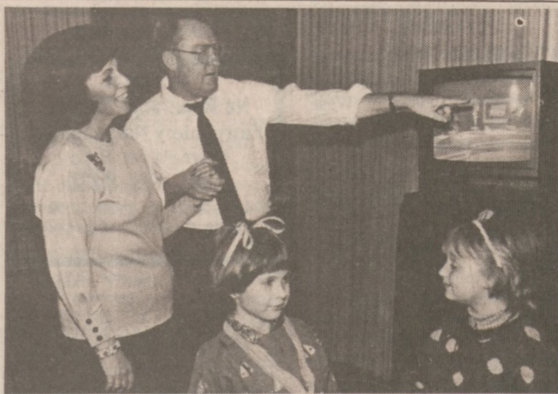
CHICAGO — Gubernator, Illinois James Thompson, z żoną oglądają sprawozdania z wyborów, w których jak się później okazało pokonał Adlai Stevensona.

U dziecka zainfekowanej matki istnieje 90 proc. szansy na uaktywnienie się wirusa "B", chyba że przedsięwzięte zostaną odpowiednie wcześniej środki zaradcze takie jak np. cesarskie cięcie.