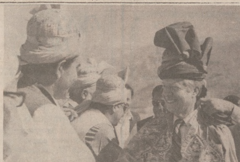
PRZEŁĘCZ CHAJBER — Były prezydent USA, Jimmy Carter w tradycyjnym turbanie plemienia Pashtun podczas wizyty w Pakistanie w rejonie granicy z Afganistanem.