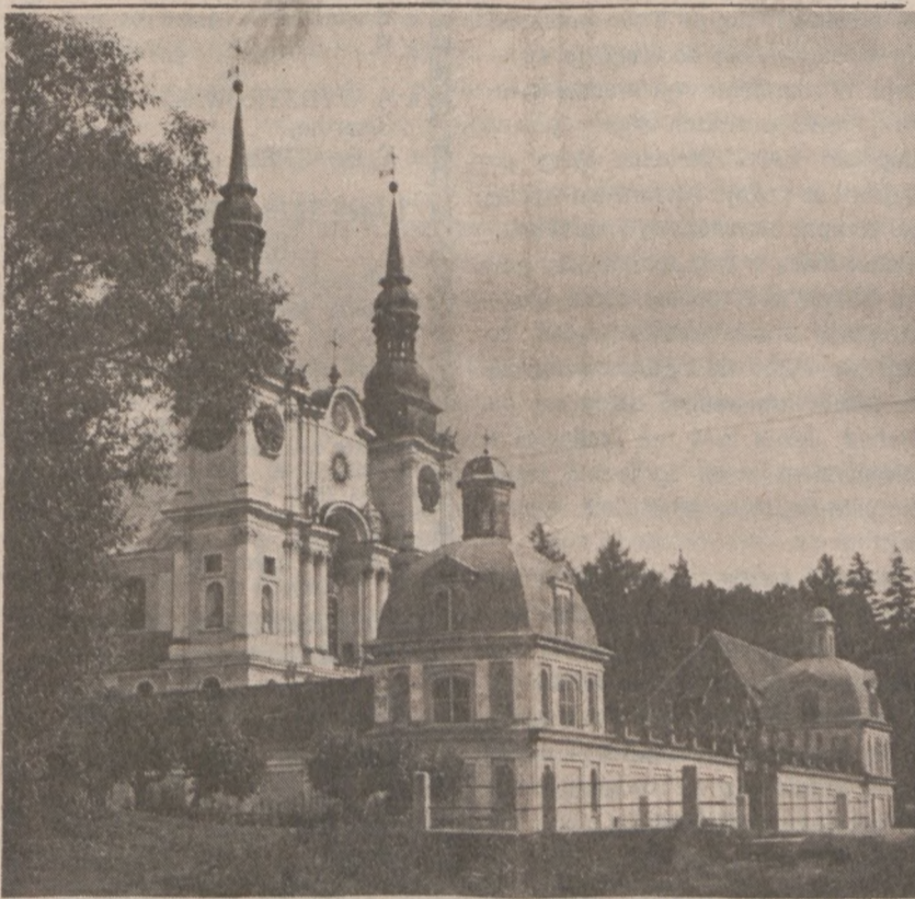
ŚW. LIPKA — Widok ogólny

Duarte powiedział, iż wydarzenia na uniwersytecie "pokazują, że w kraju panuje klimat wrotności. Studenci demonstrowali przez 50 lat na ulicach. Dlatego nie mieliby protestować na terenie własnej uczelni?"