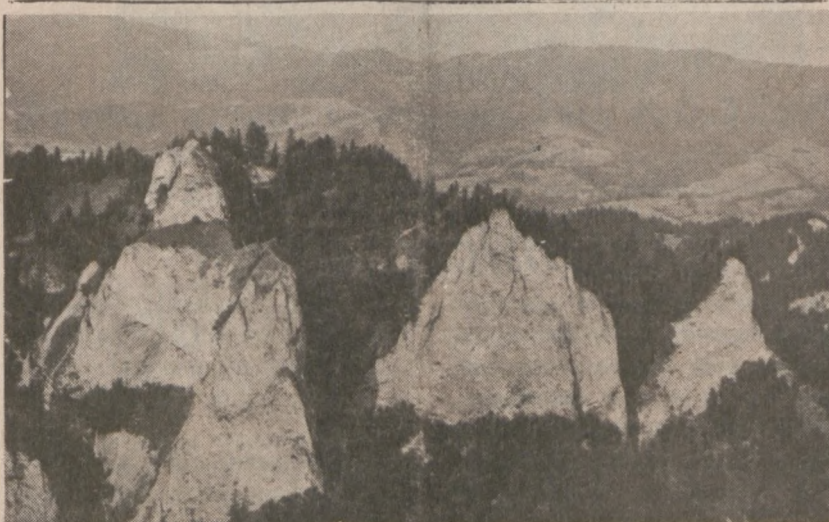
PIENINY. — Szeroka panorama gór.

Od momentu dojścia do władzy w końcu lat siedemdziesiątych wprowadził Deng wiele reform o charakterze rynkowym. Utworzenie w ostatnich trzech miesiącach giełdy papierów wartościowych, towarowej i walutowej jakby posumowuje wysiłki leciwego reformatora.