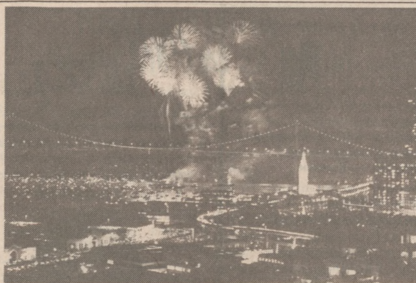
SAN FRANCISCO — Fajerwerki nad mostem San Francisco — Oakland Bay, z okazji 50-lecia jego powstania.