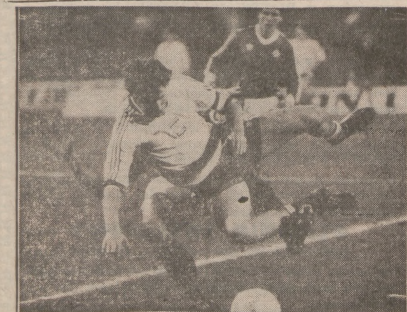
Dariusz Dziekanowski w akcji pod irlandzką bramą w wygranym meczu z Irlandią 1-0.

Augustana Hospital • Central DuPage Hospital • Chicago Osteopathic Medical Center • Frank M. Cuneo Memorial Hospital • Edward Hospital • Elmhurst Memorial Hospital • Highland Park Hospital • LaGrange Community Hospital • Lutheran General Hospital • Michael Reese Hospital and Medical Center • Northwestern Memorial Medical Center • Olympia Fields Osteopathic Medical Center • St. Francis Hospital (Blue Island) • St. Francis Xavier Cabrini Hospital • St. Joseph Hospital (Chicago) • St. Mary of Nazareth Hospital Center • St. Therese Medical Center • South Chicago Community Hospital.