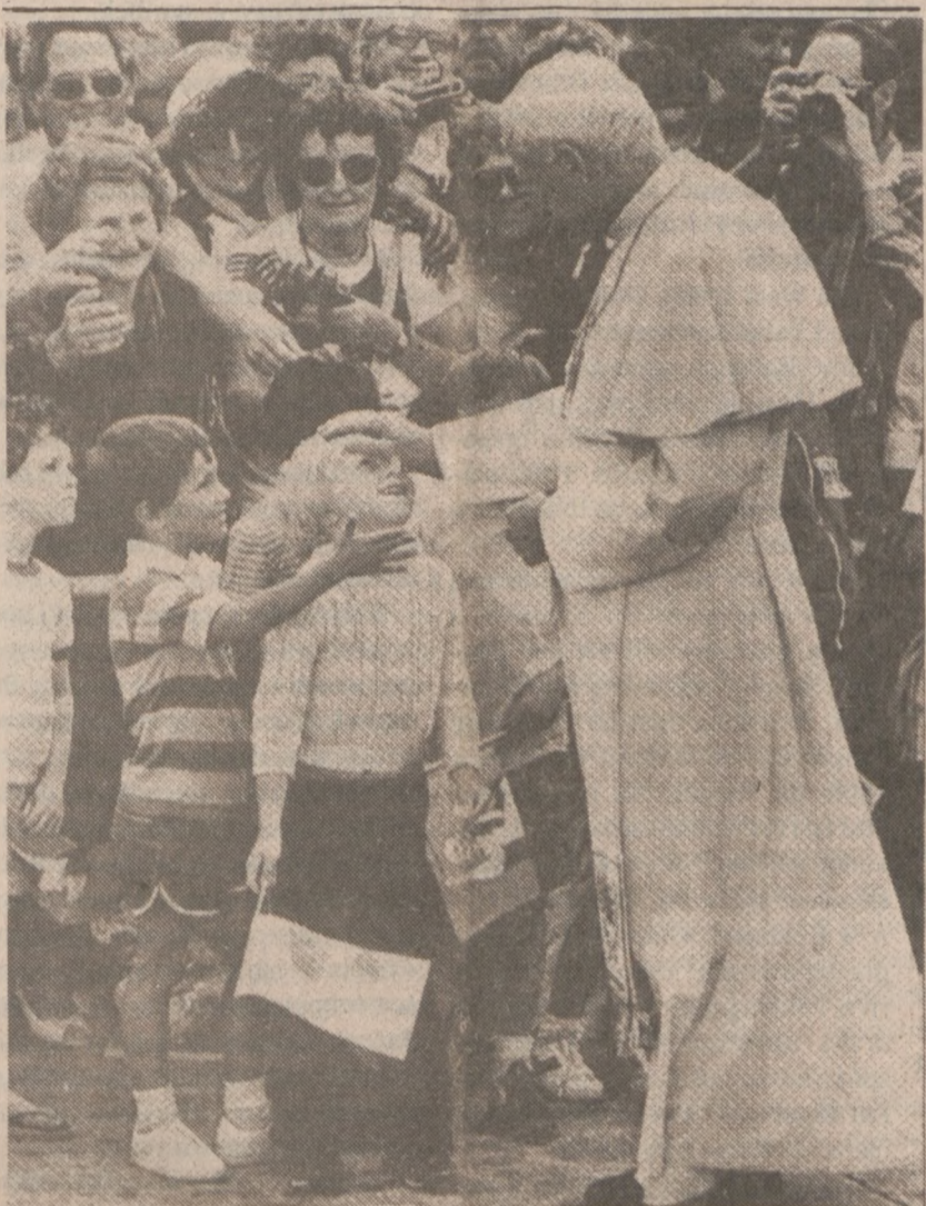
PERTH, AUSTRALIA. — Ojciec Święty w rozmowie z dziećmi.

"Jeśli władze chcą korygować swoje błędy, to muszą pozwolić na większe otwarcie ku demokracji i wyrazić zgodę na pluralizm związkowy" — dodał przywódca "Solidarności" Lech Wałęsa.