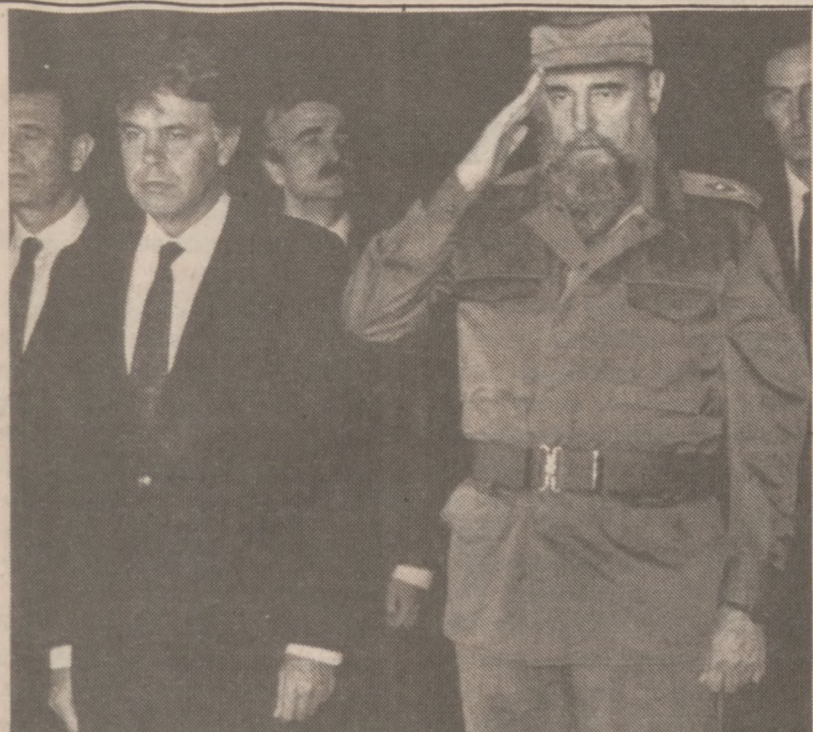
HAWANA — Fidel Castro i premier Hiszpanii Felipe Gonzales, podczas odegrania hiszpańskiego hymnu. Gonzales złożył na Kubie czterodniową wizytę.