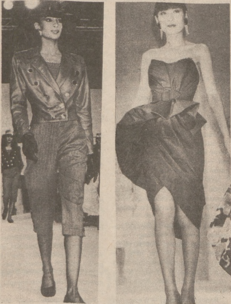
Z lewej model wiosenny z kolekcji Saint Laurent'sa, skórzany żakiet i spodnie do kolan, z prawej sukienka wieczorowa Boba Mackie.