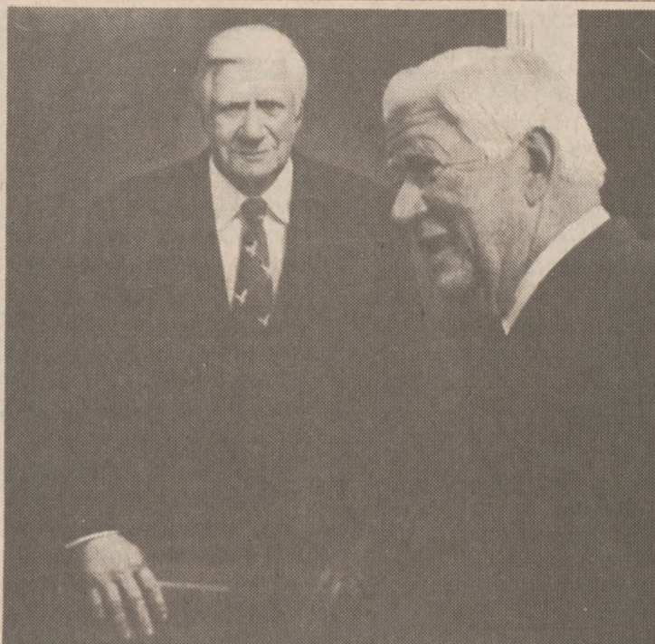
WASHINGTON — Odchodzący na emeryturę marszałek Izby Reprezentantów, Thomas "Tip" O'Neill (D., Mass.) przed własnym portretem, który został odsłonięty na Kapitału podczas uroczystości pożegnalnych.