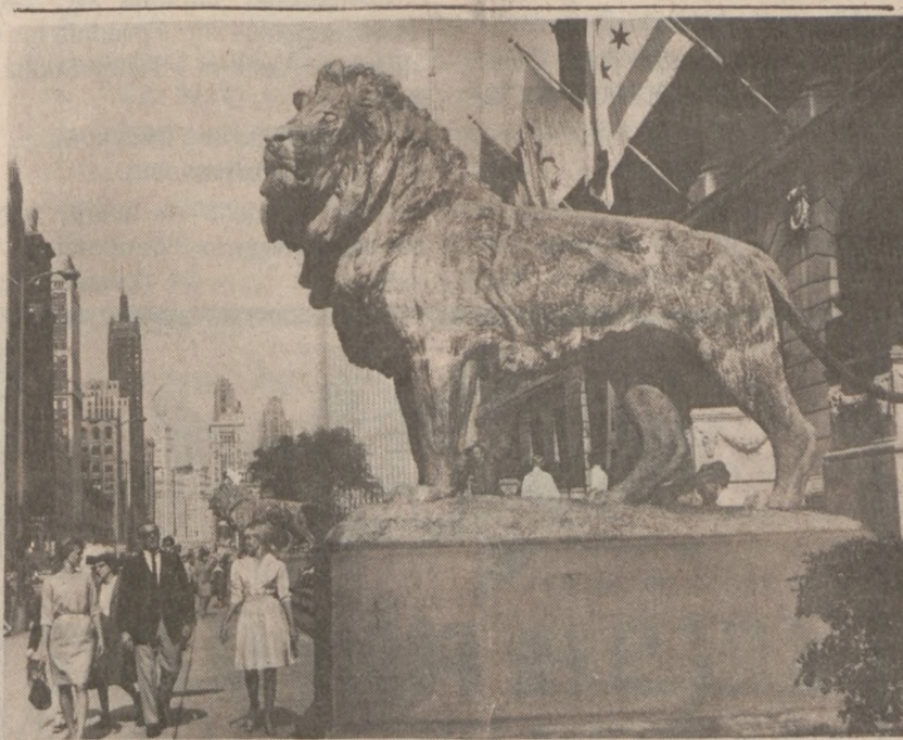
Chicago. — Lwy przed budynkiem Art Institute.

Ława przysięgłych, składająca się z siedmiu kobiet i pięciu mężczyzn, przesłuchiwała 27 świadków i zbadała 4,000 stron dokumentów. Przesłuchania i badanie materiału dowodowego trwały siedem tygodni.