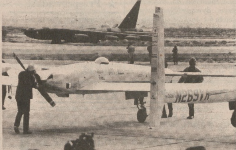
EDWARDS AFB. — Po dokonaniu pierwszej w historii podróży dookoła świata bez tankowania paliwa, eksperymentalny samolot "Voyager" pchany jest do hangaru na "zasłużony odpoczynek."

Obaj mężczyźni, którzy zostali rozpoznani przez ofiary napadów rabunkowych w czasie policyjnej procedury rozpoznawczej, będą odpowiedzialni za przestępstwa przed South Felony Court.