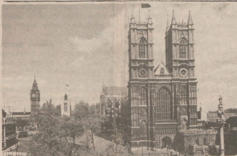
LONDYN — Opactwo Westminster,

Ataki organizacji ETA były odpowiedzialne za deportację podejrzanych o współpracę z separatystami, z sąsiedniej Francji.