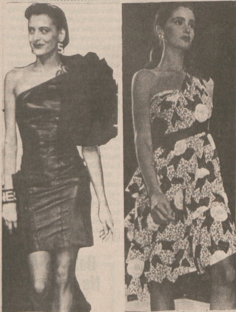
Sukienki wieczorowe pokazane przez paryski dom mody Chanel. Z prawej, sukienka z wzorzystego materiału, z lewej sukienka z czarnej skóry.