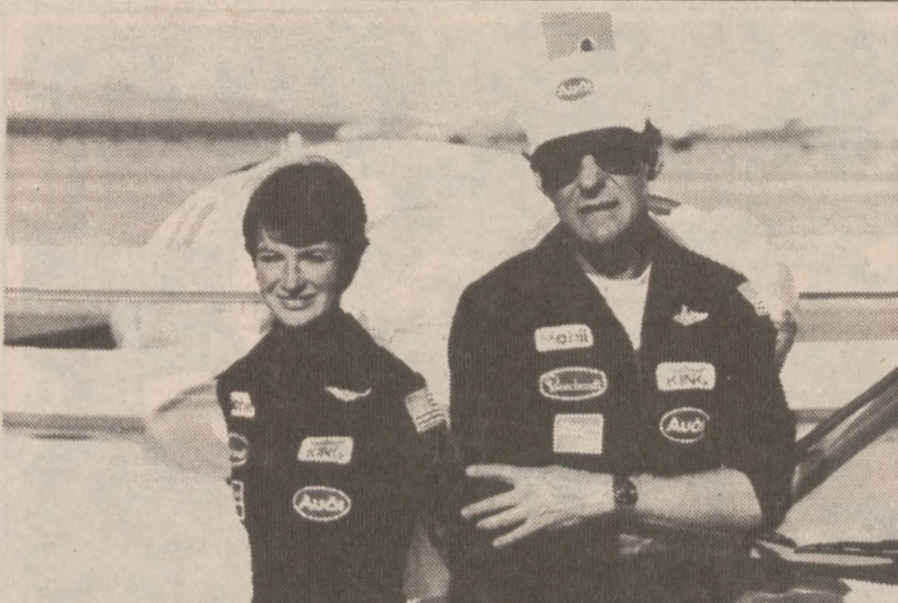
LOS ANGELES — Załoga eksperymentalnego samolotu "Voyager" wylądowała szczęśliwie po dokonaniu lotu dookoła świata bez tankowania paliwa. Kapitanem powietrznego statku był Dick Rutan (z prawej), a jedynym członkiem załogi kobieta—Jeane Yeager.