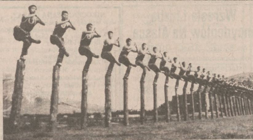
PEKIN — Oddziały Chińskiej Armii Ludowej trenują utrzymanie równowagi podczas ćwiczeń sztuki wojennej. Zdjęcie to uzyskało pierwszą nagrodę w konkursie z okazji przypadającego na 8 sierpnia Dnia Chińskiej Armii.

Nader twierdzi, iż brak kooperacji ze strony rządu w sprawie dobrowolnego usunięcia usterek samochodów przez ich producentów jest "karygodnym zaniedbaniem".