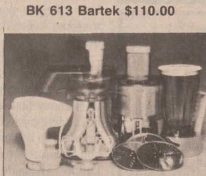
BK 613 Bartek $110.00

WIELOCZYNNOŚCIOWE ROBOTY KUCHENNE polskie i zagraniczne od $15.00 do $110.00