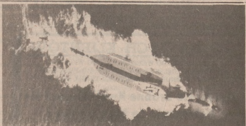
PEKIN — Pierwsza zaprojektowana i zbudowana przez Chińczyków atomowa łódź podwodna podczas swej pierwszej podróży po wodach Morza Chińskiego.