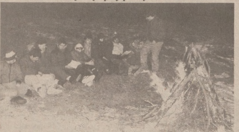
Przy ognisku na śniegu