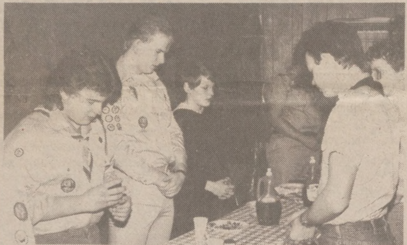
Modlitwa przed posiłkiem