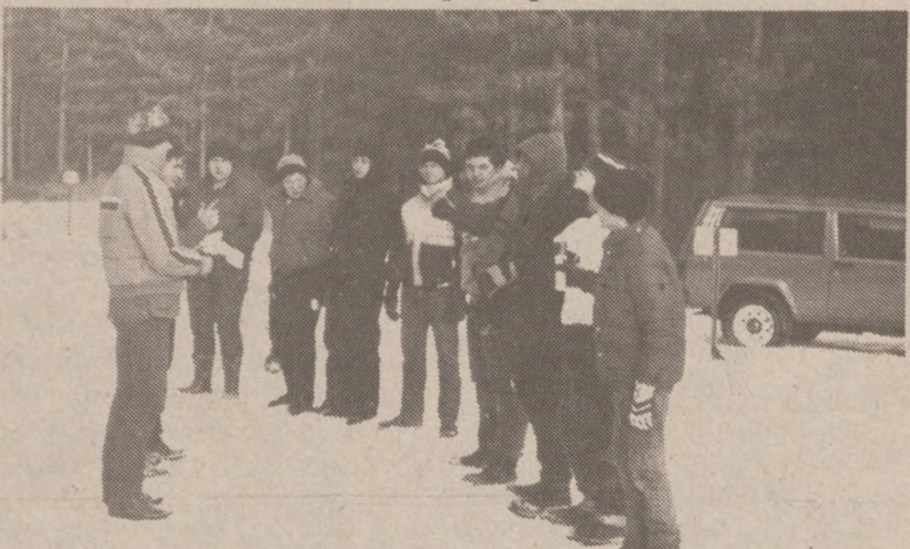
Przed wymarszem za tropem