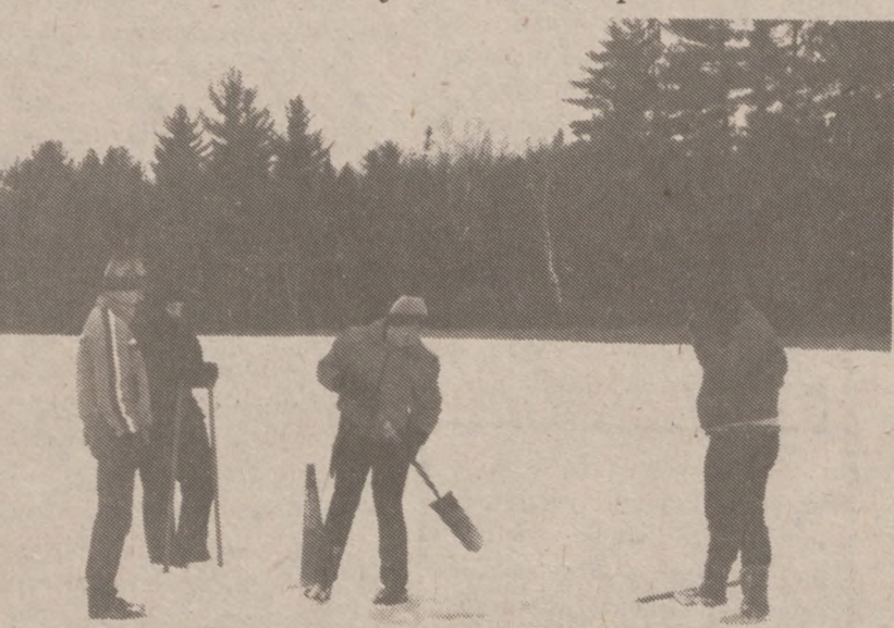
"Rybacy" przy przerębli