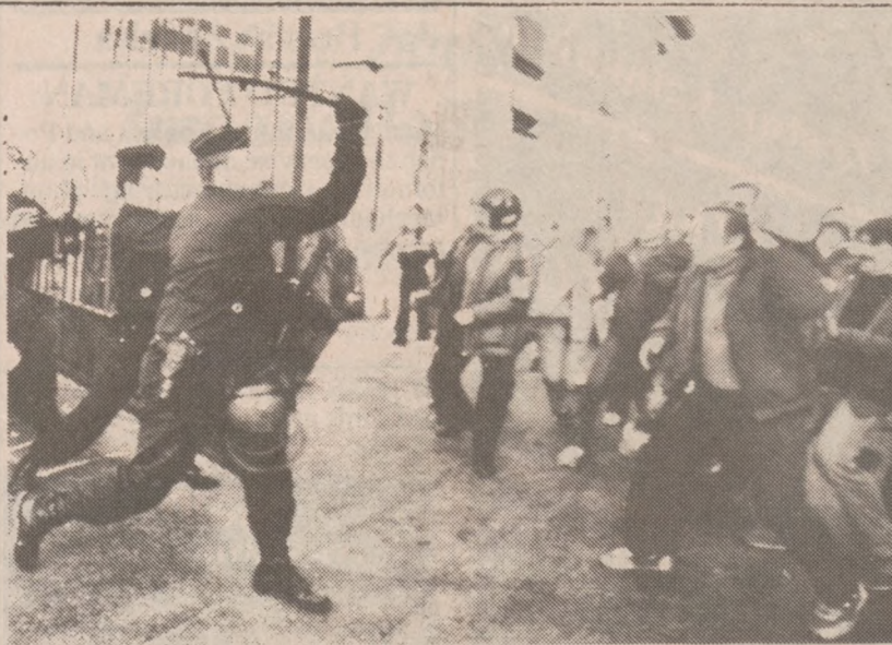
NICEA — Strajkujących kolejarzy próbujących dostać się do głównego budynku dworca w Nicei rozprędyli silne oddziały policji.