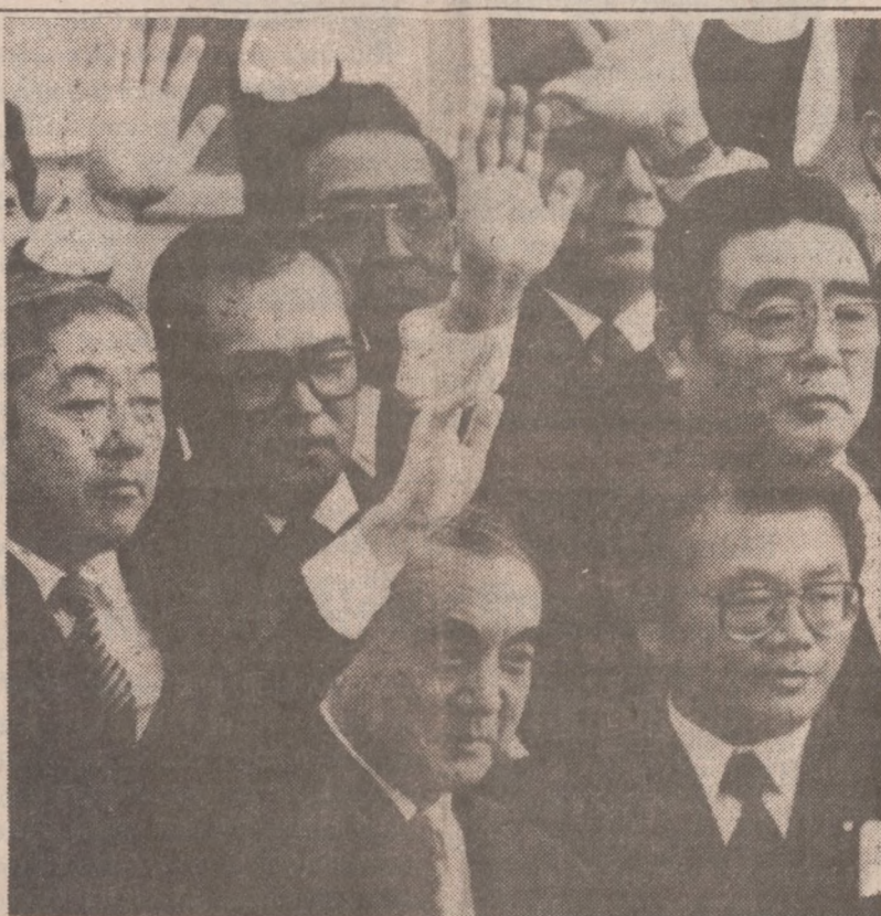
TOKIO, JAPONIA. — Premier Japonii Nakasone rozpoczął w sobotę swą podróż do krajów Europy Wschodniej. Odwiedzi między innymi: Niemcy Wschodnie, Polskę i Jugosławię. Dzisiaj znajduje się w Finlandii.

Oprócz spraw handlowych, spodziewanym jest, że Nakasone dyskutować będzie z przedstawicielami państw, które odwiedzi, sprawy związane z kontrolą produkcji atomowej i rozbrojenowej.