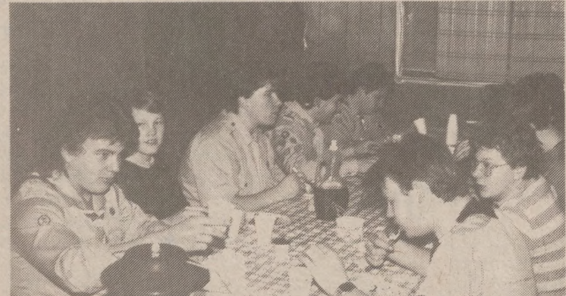
Skromny posiłek przed zbiórką

Zadzwoń Po Umówienie Sie Porady Bezpłatne 281-8744 24 Godzinny/7 Dni w Tygodniu 2918 N. MILWAUKEE 77 W. Washington • Pokój 1412