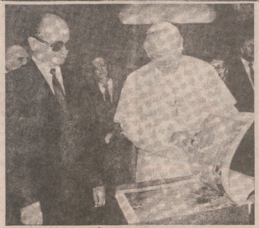
WATYKAN — Ojciec Święty Jan Paweł II przyjął na prywatnej audiencji gen. W. Jaruzelskiego.