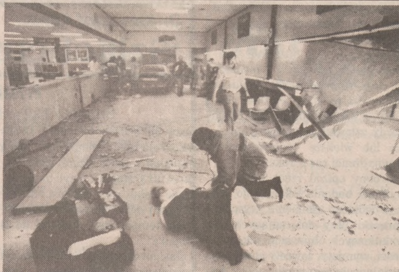
CHULA VISTA — W jednym z miasteczek w Kalifornii samochód wjechał do biura załatwiającego sprawy zmotywowanych i wydającego prawa jazdy. Przynajmniej 20 osób odniosło poważne obrażenia.

Niezależne wydawnictwa to największe, trwale osiągnięcia Polaków od czasu wprowadzenia stanu wojennego. Nic nie wskazuje na to, aby represje władz były w stanie przerwać to pasmo sukcesów.