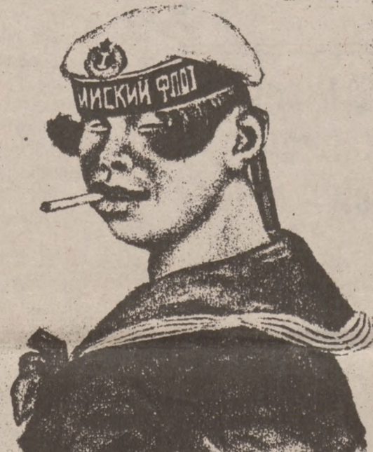
„DUMA ROSYJSKIEJ REWOLUCJI” (marynarz zbuntowanej floty carskiej)

Widma z podziwem i strachem patrzyły na przechadzającego się po placu Kremlo-wskim małego człowieka o lysiej czaszce, mongolskich policzkach, wargach i oczach.