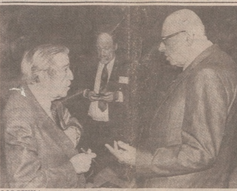
MOSKWA — Andrej D. Sacharow w rozmowie z amerykańskim uczonym Jerome B. Weisner w czasie konferencji na temat produkcji broni jaka odbyła się w Moskwie w ostatnich dniach.

Washington (CT) — W przeciwieństwie do częstych oskarżeń ZSSR przez reaganowską administrację o nie przestrzeganie układów rozbrojeniowych. Naukowcy z Ośrodka Bezpieczeństwa Międzynarodowego Uniwersytetu Stanford oświadczyli, że obie strony stosują się do postanowień zawartych układów.