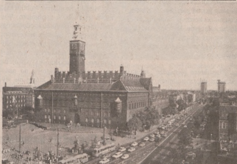
KOPENHAGA. — Rynek i ratusz miejski.