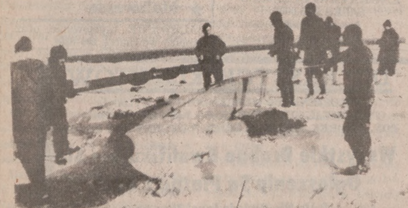
COLD LAKE. — W Kanadzie dokonano udanej próby z nowym typem amerykańskiej rakiety "Cruise." Na zdjęciu, żołnierze US Air Force zabierają raketę do bazy.

Od 40,000 do 50,000 głosów złożonych było niewłaściwie.