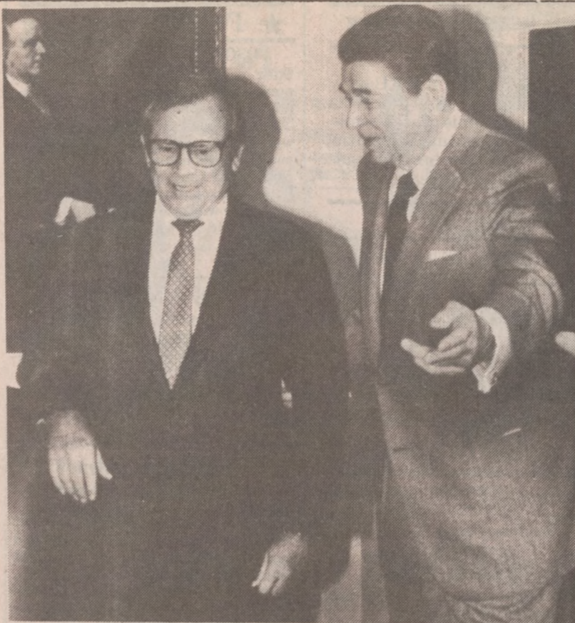
WASHINGTON — Howard Baker mianowany niedawno na stanowisko szefa sztabu Białego Domu w towarzystwie prezydenta Reagana udaje się na pierwsze posiedzenie gabinetu.

Mieszkańcy Naperville zapowiedzieli, iż odwoływać się będą do wszelkich możliwych instancji, gdyż sprawiedliwości musi stać się zadość."