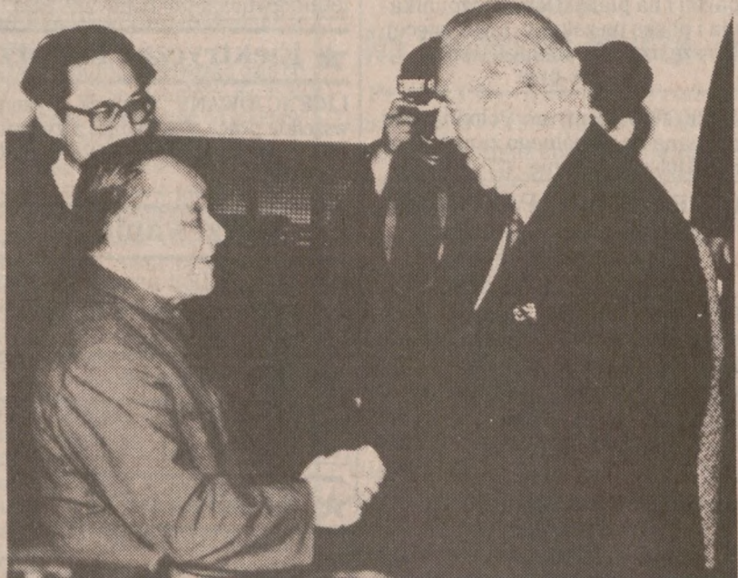
PEKIN.—George Shultz złożył pięciodniową wizytę w Chinach. Amerykański sekretarz stanu w Pekinie spotkał się z chińskim przywódcą Deng Xiaopingiem.

Sobota, 7 marca, 87 04 09 25 40 41 43 Środa, 4 marca, 87 10 13 16 33 37 38