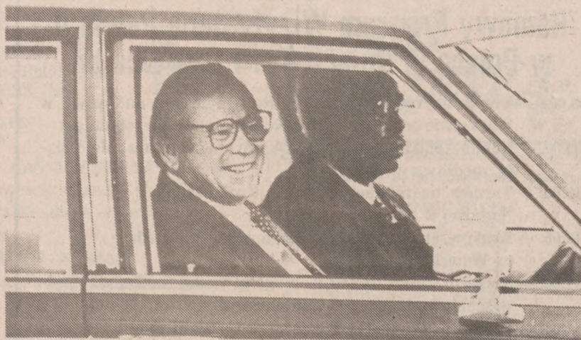
WASHINGTON — Były przywódca senackiej większości Howard Baker zastąpił Donalda Regana, na stanowisku szefa sztabu Białego Domu. Na zdjęciu Baker w pierwszym dniu swego urzędowania udaje się Białego Domu.

Dystans zostanie podzielony na 12 etapów, każdy o długości 20-50 km. Trasa będzie biegła częściowo po Wielkim Murze, który ma 6-8 metrów szerokości, częściowo drogami i ścieżkami znajdującymi się u jego podnóża. Start odbędzie się u jego jednej z wież w odległości ok. 70 km od Pekinu, natomiast meta jest w jednym z uzdrowisk położonych nad Morzem Chińskim.