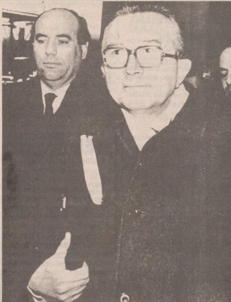
RZYM — Minister spraw zagranicznych Giulio Andreotti otrzymał misję utworzenia nowego rządu, który będzie już 46 w powojennej historii Włoch. Andreotti opuszcza właśnie gabinet Bettino Craxi.