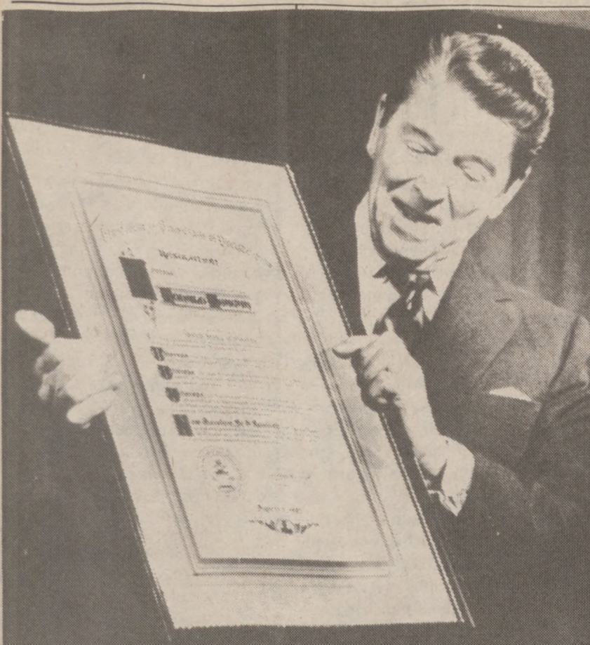
FILADELFA — Prezydent Reagan spotkał się z wykładowcami filadelfijskiego "College of Physicians", gdzie omawiano sprawy opieki zdrowotnej, a szczególnie problem walki z chorobą AIDS. Na zdjęciu, Prezydent przedstawia tekst rezolucji uchwalonej na tym spotkaniu.