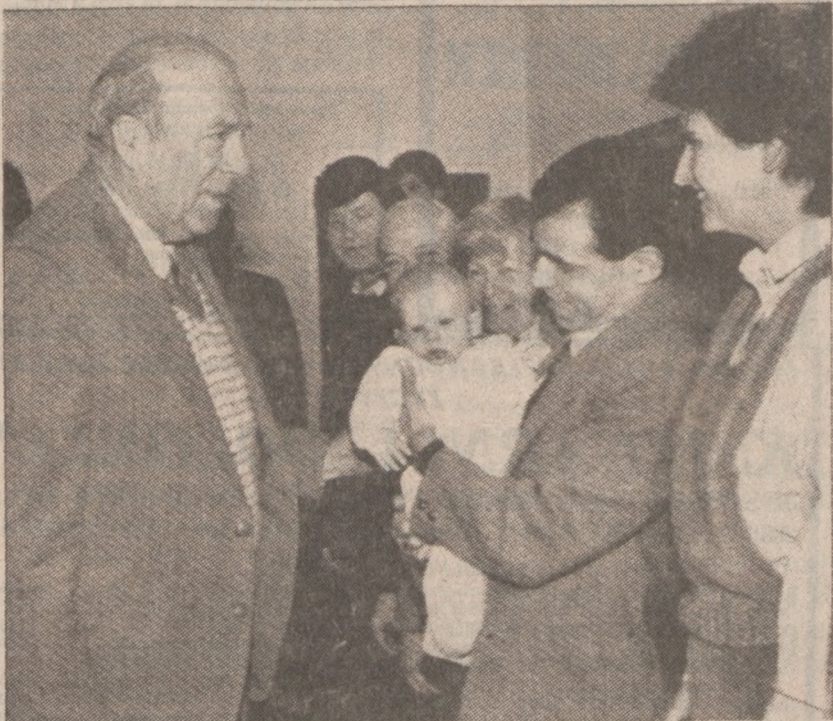
MOSKWA — W czasie swojej trzydniowej wizyty w ZSSR sekretarz stanu George Shultz spotkał się z rodzinami Amerykanów, którym nie pozwolono na wyjazd do U.S.

Odwołanie do Sądu Najwyższego USA o zniesienie decyzji o wydaleniu Linnasa z USA będzie rozpatrywane po raz kolejny, lecz prokurator Meese twierdzi, że tym razem "sprawa ta będzie rozpatrzona tak, jak poprzednio." Wcześniej Sąd Najwyższy dwukrotnie wydał decyzję, że zbrodniarz wojenny Karl Linnas powinien być deportowany ze Stanów Zjednoczonych, by mógł stanąć przed sądem i ponieść odpowiedzialność za popełnione zbrodnie."