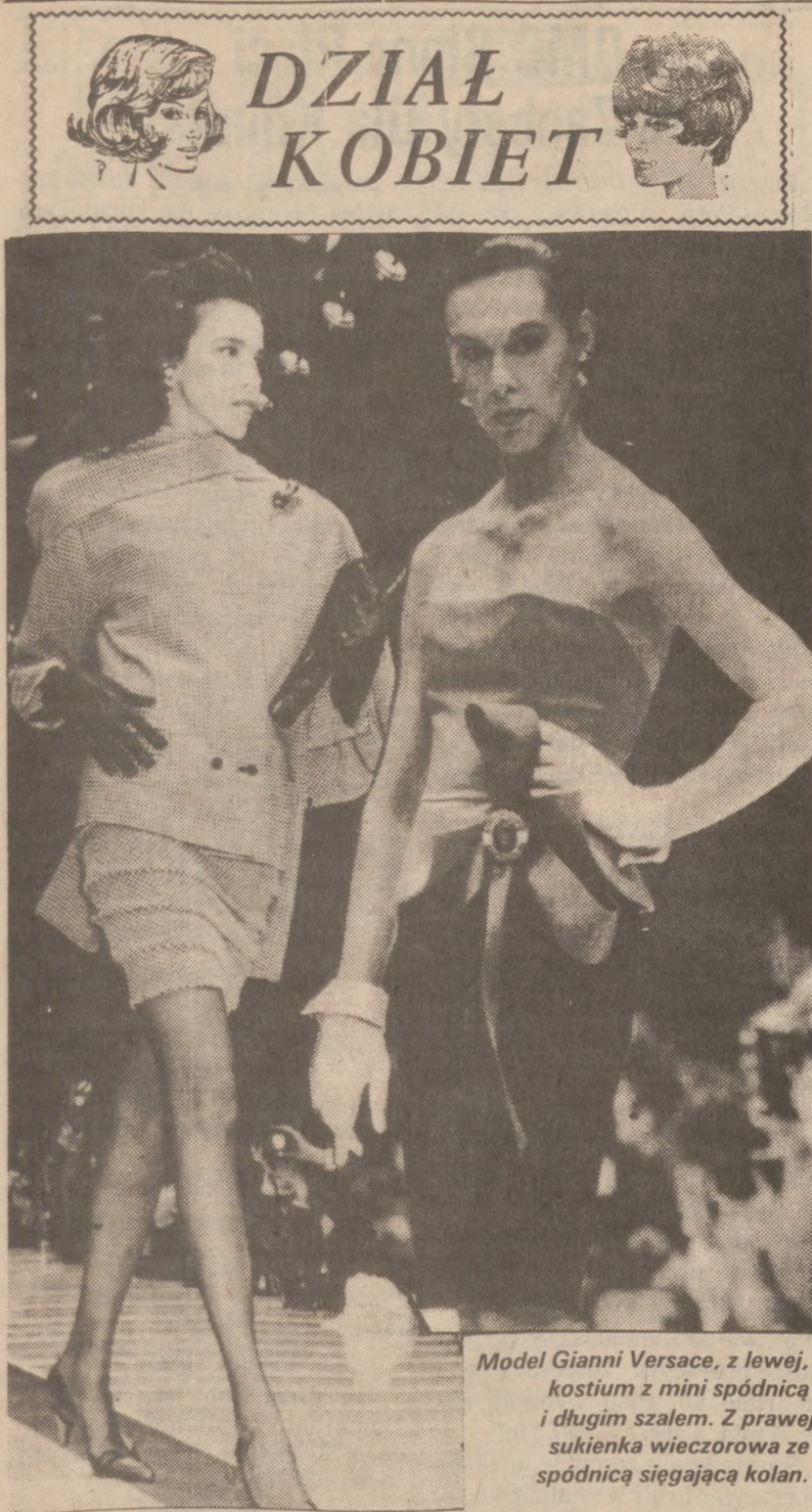
Model Gianni Versace, z lewej, kostium z mini spódnicą i długim szalem. Z prawej sukienka wieczorowa ze spódnicą sięgającą kolan.