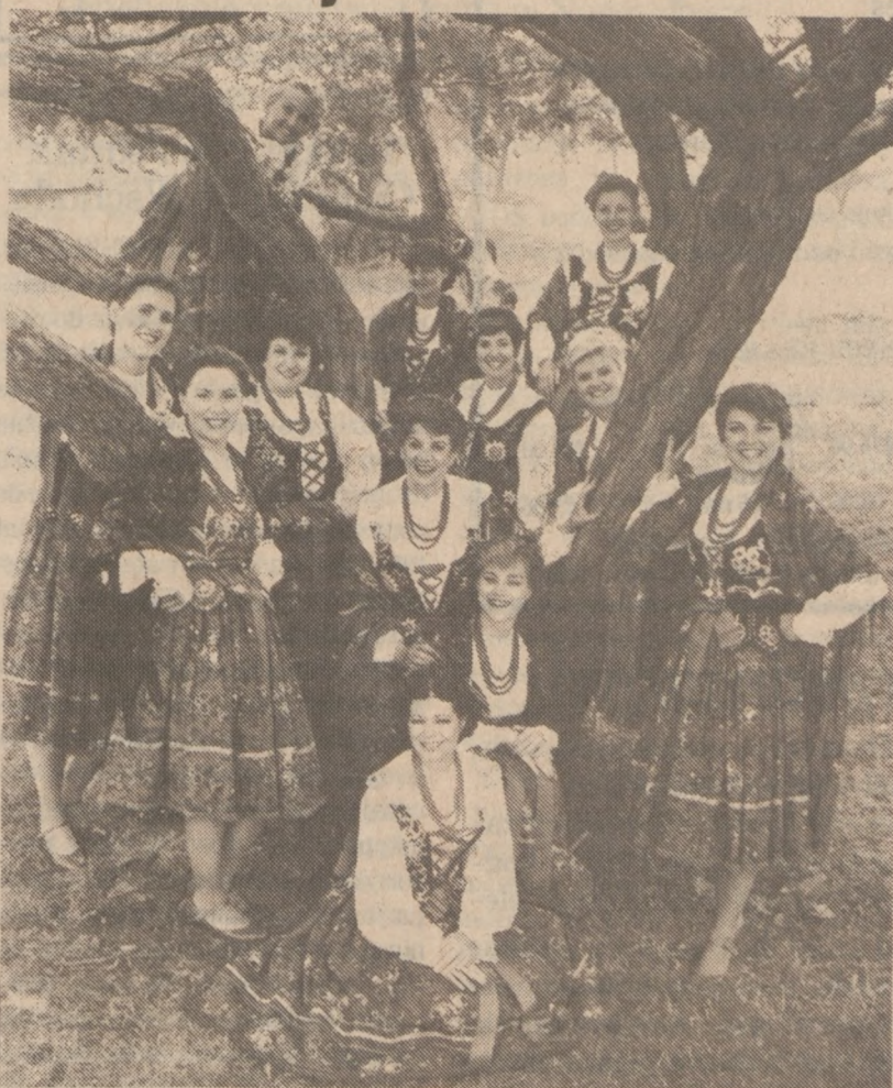
Zespół "Lira Singers" w strojach góralskich.

Zespół "Lira Singers", słynący z popularyzacji muzyki polskiej, zamierza uczcić rocznicę Konstytucji 3 Maja oraz dwusetną rocznicę Konstytucji Stanów Zjednoczonych poprzez zorganizowanie "Festynu Polskiej Pieśni i Tańca", który odbędzie się we wspólnym teatrze Rialto Square w Joliet, Illinois, w niedzielę, 3 maja br., o godzinie 3-iej po południu.