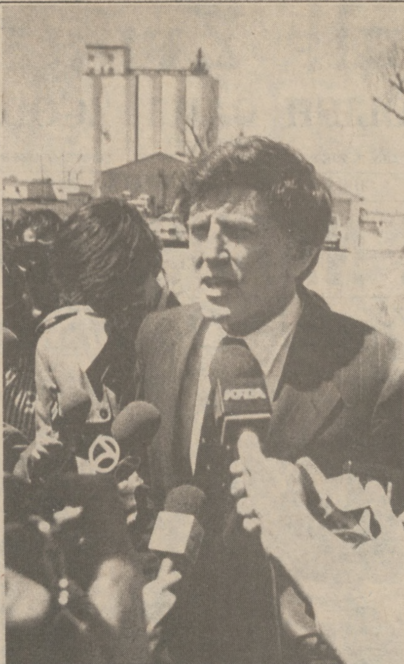
AMARILLO — Gary Hart rozpoczął swą kampanię prezydencką. Na zdjęciu, Hart rozmawia z reporterami radia i telewizji po przedwyborczym spotkaniu z mieszkańcami teksaskiego miasta Amarillo.

W dziedzinie magnesów stałych zanotowano równie rewelacyjne osiągnięcia. Niedoceniane dotąd pierwiastki tzw. ziem rzadkich (stosunkowo rzadko występujących