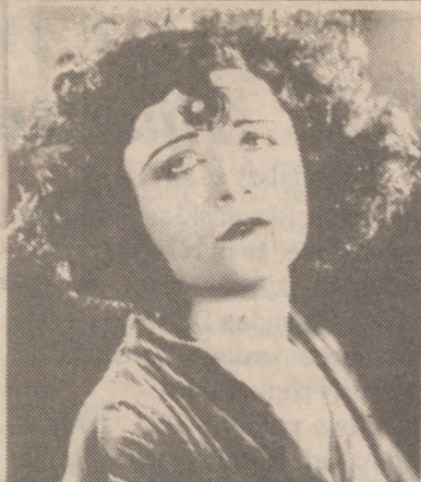
SAN ANTONIO — W wieku 87 lat w Teksasie zmarła aktorka Pola Negri. Pochodziła z Polski, a jej prawdziwe nazwisko brzmiało Apolonia Chalupec.