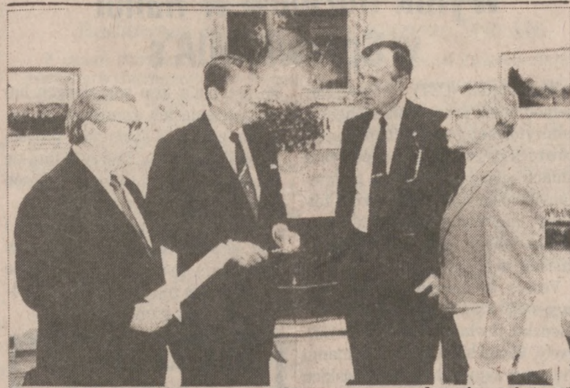
WASHINGTON — Po naradach na temat bezpieczeństwa kraju. Od lewej — szef sztabu — Howard Baker, prezydent Reagan, wiceprezydent — George Bush i doradca do spraw bezpieczeństwa — Frank Carlucci.

Zapowiedziano również, że żadne państwo nie zapewni sobie bezpieczeństwa poprzez prowadzenie operacji pod inną banderą. Było to ostrzeżenie skierowane bezpośrednio do USA i Kuwejtu. Ostatni kuwejckie tankowce pływają pod amerykańską flagą a okręty wojenne USA chronią je przed irańskimi atakami.