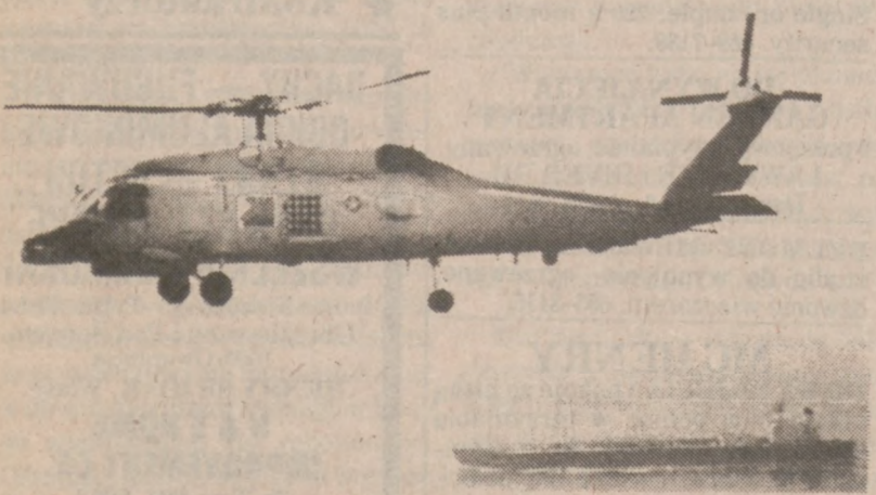
ZATOKA PERSKA — Należący do US Navy helikopter patroluje przestrzeń powietrzną nad pływającym w kierunku Cieśniny Ormuz kuwejckim tankowcem "Gas Prince".

Środa, 12 sierpnia, 87 07 08 10 13 29 36 37