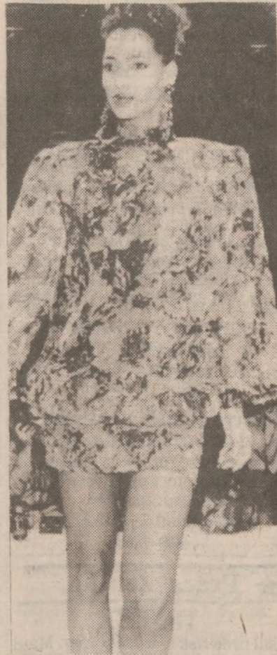
Z lewej, sukienka mini Pierre Cardina, z prawej, sukienka z wzorzystego materiału, mini spódnica i bardzo obszerna bluzka.