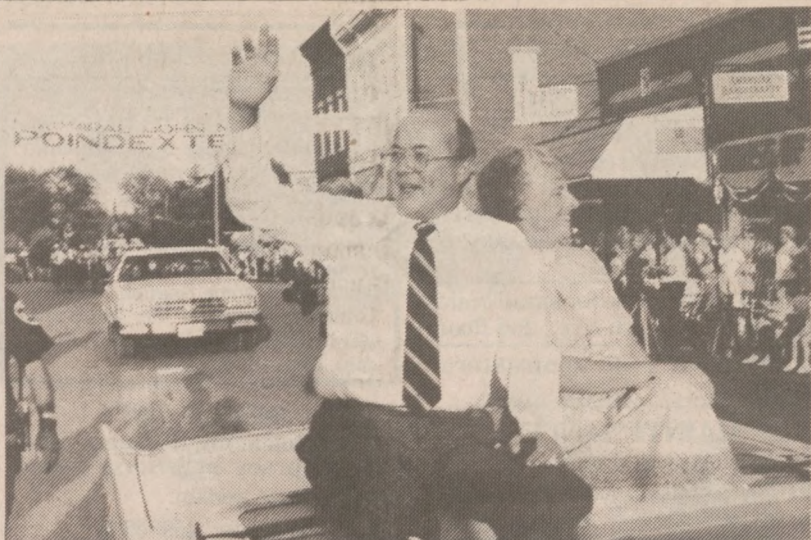
ODON, IND. — Adm. John Poindexter w otwartym samochodzie przejechał ulicami miasta Odon w stanie Indiana, gdzie ze swą małżonką Lindą był gościem honorowym parady z okazji "Old Settlers Day."