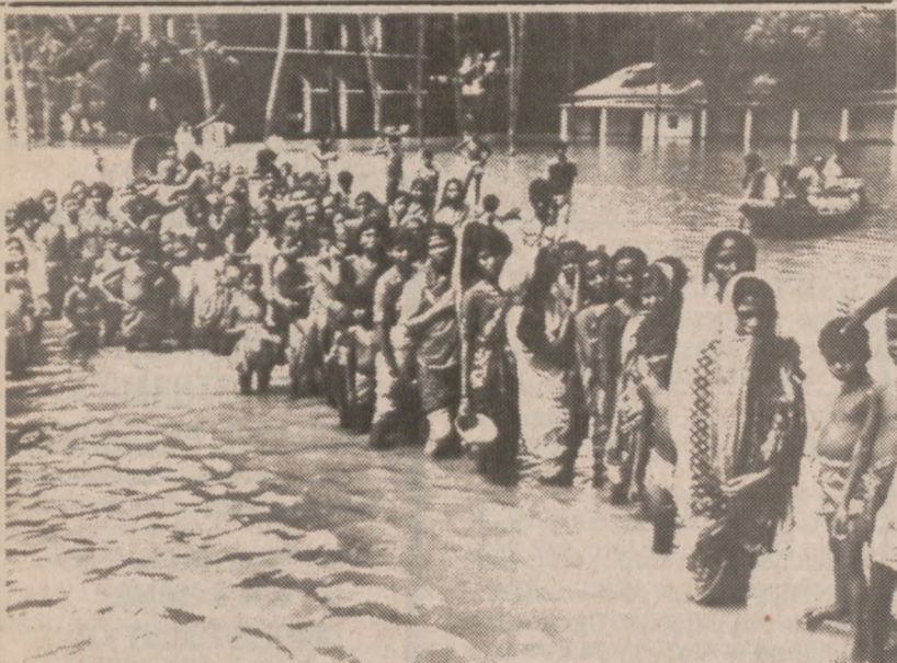
RAJBARI — Powódź nawiedziła duże obszary Bangladeszu. Mieszkańcy jednej z wiosek stoją w kolejce po miskę ryżu rozdawaną przez agencję rządową.