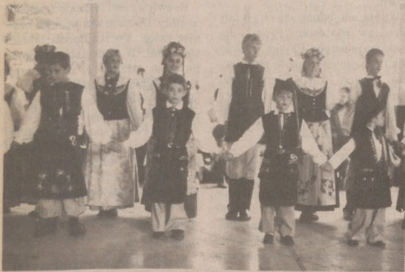
Zespół Pieśni i Tańca przy szkole im. T. Kościuszki w Chicago.

POLONIA BOOKSTORE 2886 N. MILWAUKEE TEL 489-2554