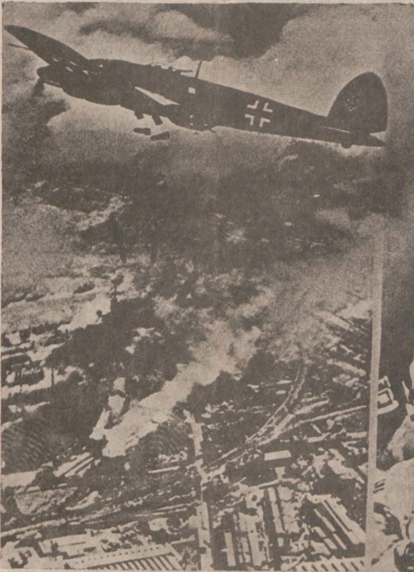
Dzisiaj mija 48 rocznica wybuchu II Wojny Światowej. Niemcy zaatakowały Polskę. Na zdjęciu samoloty niemieckie bombardują nasz kraj. (Zdjęcie archiwalne)