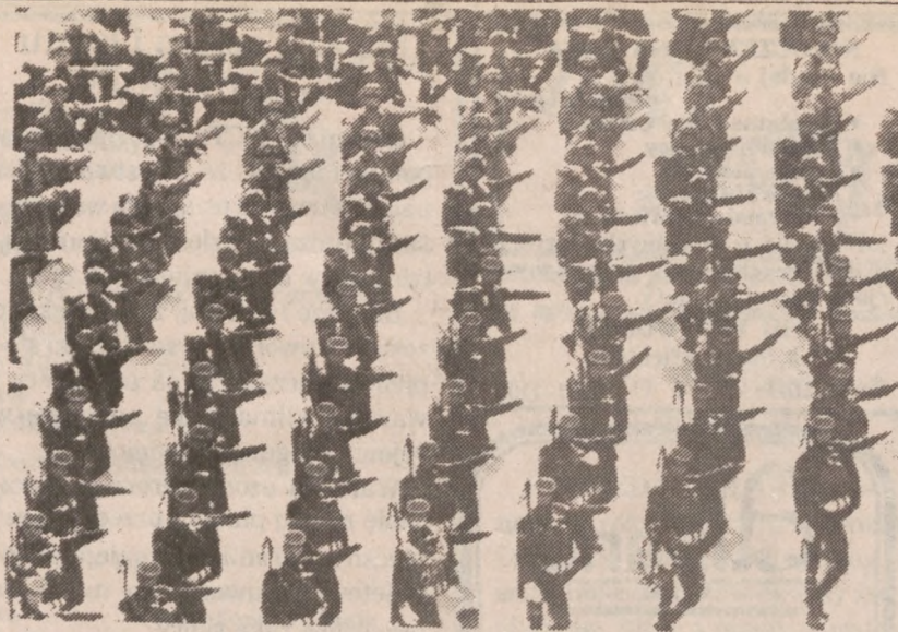
SEUL — Z okazji Dnia Sił Zbrojnych w Seulu odbył się parad marasz doborowych oddziałów południowokoreańskiej armii.

Podczas pobytu w Washingtonie sowiecki minister spraw zagranicznych, Eduard Szewernadze, powiedział, że strona sowiecka pragnie spotkania poświęconego zagadnieniu kontroli zbrojeń.