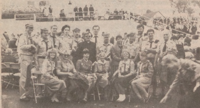
Harcerska delegacja z Chicago na spotkanie z Ojcem Św. w Detroit, w dniu 19 września 1987 r.

Lódz... Tu 13 czerwca Papieżowi również licznie pokazały się harcerze. Swe służby skoncentrowali głównie na patrolach lekarsko-harcerskich. W Łodzi bierze udział w "Białej Służbie" — która tu ma zasięg lokalny — ok. 500 starszych harcerzy. Przybyli tu harcerze z innych miast m.in. z Poznania (200 harcerzy), Konina, Kuluszek, Kalisza, Zgierza, Pabianic, Zduńskiej Woli, Łowicza.