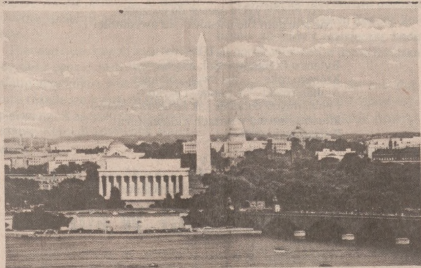
WASHINGTON — Widok miasta.

W Tokio przedstawiciele irańskiej ambasady powiadomili japońskie władze, iż Iran "nie ma zwyczaju" atakować jednostek państw zaprzyjaźnionych. Zapewniono rząd japoński o przyjaznych intencjach wobec kontenerowców i tankowców płynących pod japońską banderą. Ambasada irańska oświadczyła, iż szybkie łodzie gwardzystów rewolucyjnych nie miały nic wspólnego z atakami na japońskie jednostki. Jak pamiętamy Japonia wstrzymała ruch swych jednostek, aż do zdobycia pewności, że nie grozi im żadne niebezpieczeństwo podczas żeglugi w Zatoce Perskiej.