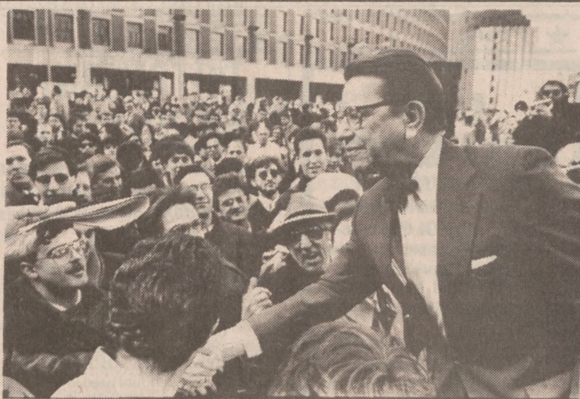
BOSTON — Senator Paul Simon z Illinois odwiedził Boston, gdzie utworzył swą kwaterę kampanijną na stan Massachusetts. Na zdjęciu, sen. Simon wymienia uściski dłoni ze swymi przyszłymi wyborcami.