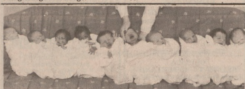
ST. PAUL — W szpitalu dziecięcym w St. Paul w stanie Minnesota w ciągu zaledwie 24 godzin na świat przyszło aż pięć par bliźniaków. Ustawienie ich do wspólnej fotografii nie było zadaniem łatwym.

Pomimo podeszłego wieku, zmarły pracował na pół etatu w Continental Bank i był uważany za energicznego i rześkiego.