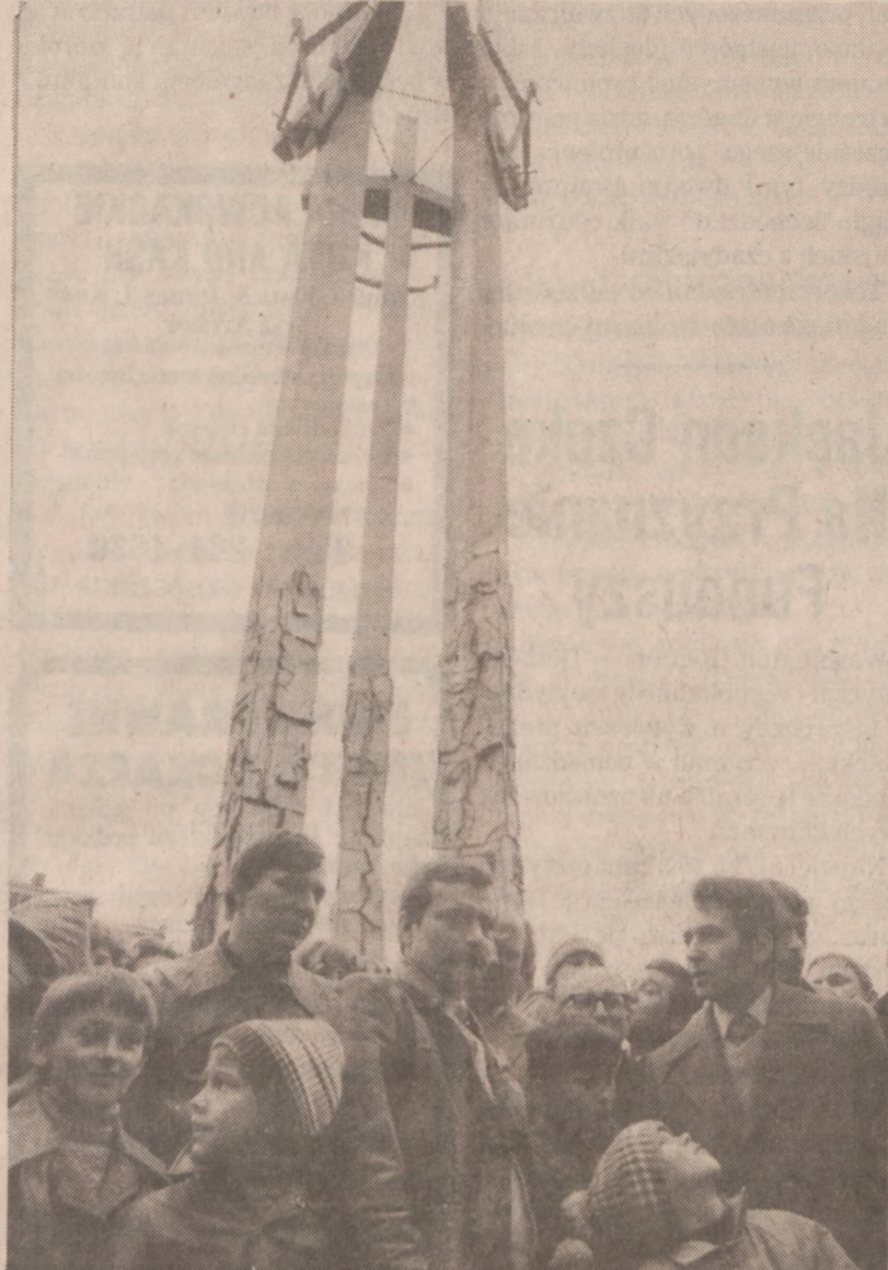
GDĄSK - Pomnik Stoczniovców, wzniesiony w 1980 r. dla upamiętnienia ofiar jakie padły w 1970 r. Zdjęcie to zrobione zostało zaraz po odsłonięciu pomnika w grudniu 1980 roku.

Wyrok ten jest bardzo niski, jeśli porówna się z wyrokami w procesach politycznych.