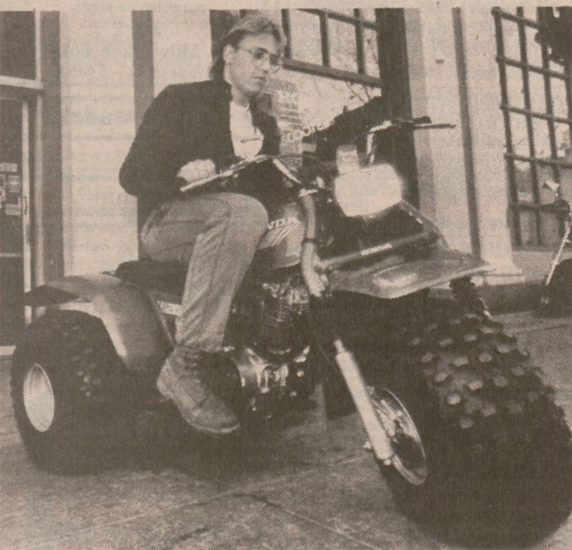
WASHINGTON — Rząd USA zakazał sprzedaży w Stanach Zjednoczonych trójkołowych pojazdów terenowych typu ATV. Wadliwa konstrukcja tych pojazdów była bezpośrednią przyczyną śmierci przynajmniej 900 osób w ciągu ostatnich 5 lat.