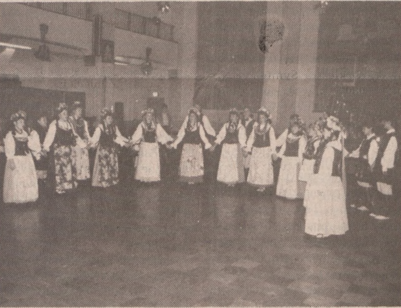
Zespół pieśni i tańca ze szkoły im. T. Kościuszki

Widzieliśmy też młodych solistów w oberku i obrazkach obyczajowych. Na zakończenie wykonuje ognistego krakowiaka z takim żywiołem że aż ma się ochotę ruszyć z