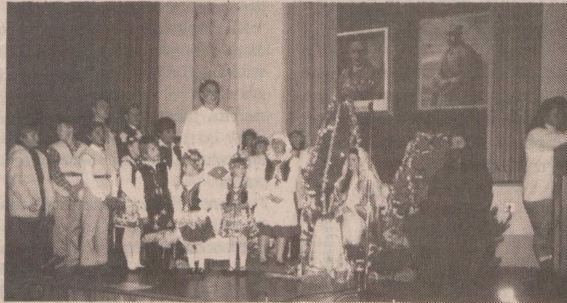
"Jasełka" w wykonaniu młodzieży ze szkoły im. M. Konopnickiej