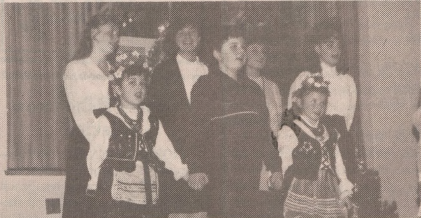
Uczniowie ze szkoły im. K. Pułaskiego

Do kalendarza imprez polonijnych na stałe wpisał się "oplatek nauczycieli" tradycyjnie organizowany przez Zrzeszenie Nauczycieli Polskich w Ameryce.