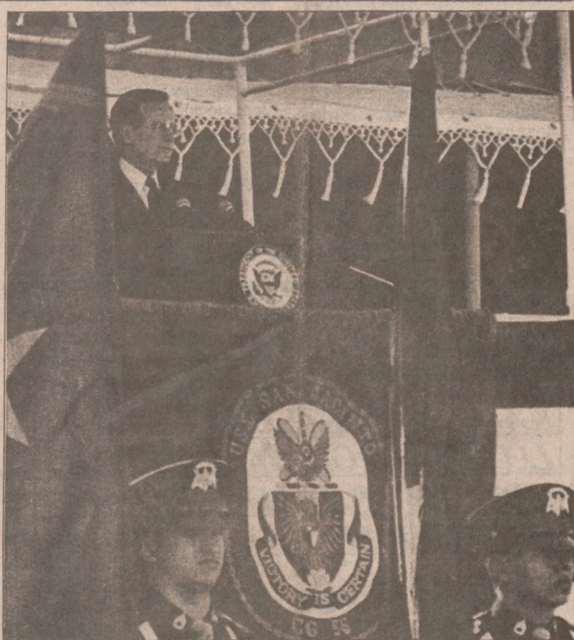
HOUSTON — Wiceprezydent George Bush wziął udział w ceremonii rozpoczęcia służby krawownika "USS San Jacinto".