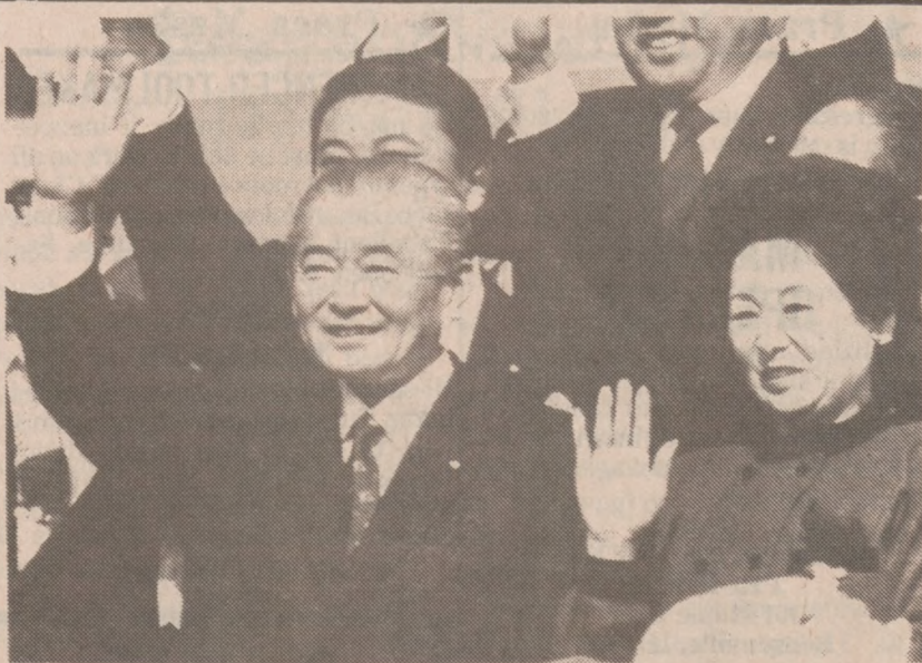
TOKIO — Premier Japonii Noboru Takeshita i jego małżonka Naoko na tokijskim lotnisku Haneda żegnają odprowadzających gości udając się z 9-dniową wizytą do Stanów Zjednoczonych i Kanady.

Podczas przeprowadzonej wcześniej rozprawy cywilnej, Pawlik został oskarżony przez U.S. Securities and Exchange Commission o użycie należących do klientów $538 tys. w celu przeprowadzenia na własną rękę machinacji giełdowych, na skutek czego, jeden z inwestorów, wdowa z Chicago Heights, straciła prawdopodobnie $190 tys.