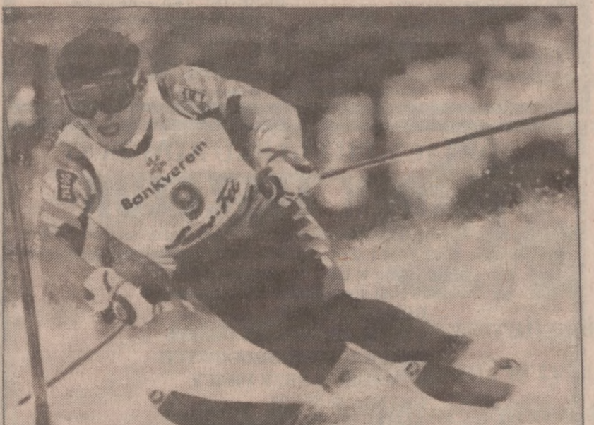
Włoski narciarz Alberto Tomba (po wielkim sezonie) na zimowych igrzyskach olimpijskich w Calgary zdobył dwa złote medale w slalomie specjalnym gigantycznym.