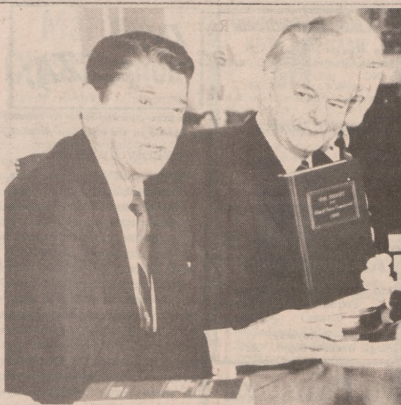
WASHINGTON — Prezydent Reagan przedstawia kopię ustawy budżetowej na rok fiskalny 1989. Z prawej, przywódca senackiej większości sen. Robert Byrd.