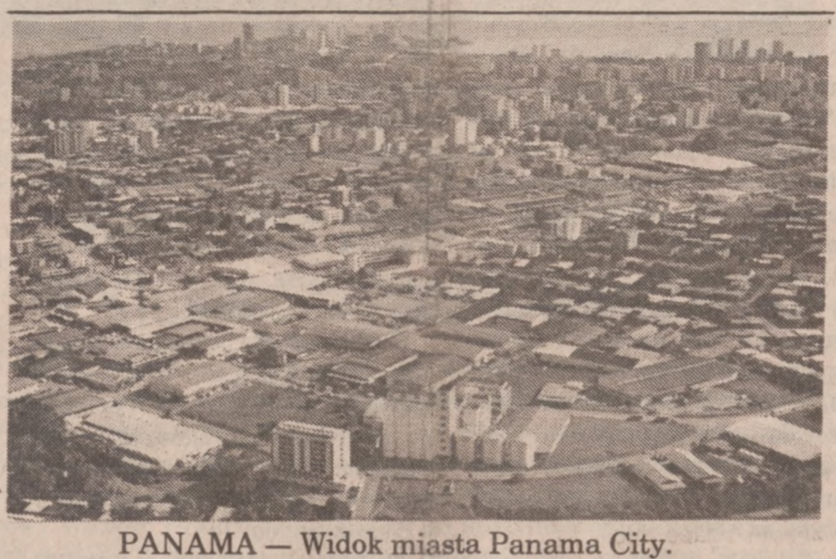
PANAMA — Widok miasta Panama City.

Panama City (Reuter, CT) — Trwający od dwóch dni strajk generalny w Panamie przybrał we wtorek na sile. Jednak na ulicach stolicy zjawiało się więcej oddziałów wojska i policji. We wtorek 12 banków nie należących do państwa podjęło jednoznacznie decyzję o zamknięciu swych placówek aż do chwili, gdy wygaśnie kryzys ekonomiczny i polityczny w Panamie. Także zamknięto większość banków zagranicznych w tym też amerykańskie instytucje finansowe. Nieczynna była także większość sklepów w Panama City. Celem strajku generalnego jest (Dokończenie na str. 8-ej)