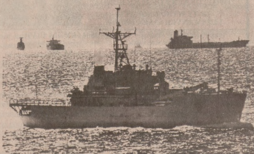
ZATOKA PERSKA — Na wodach Zatoki Perskiej doszło do bliskiego spotkania irańskiego okrętu wojennego (na pierwszym planie) z konwojem kuwejckich tankowców eskortowanych przez jednostki USA. Do wymiany ognia nie doszło.

Dostęp na niektóre piętra zostanie ograniczony.