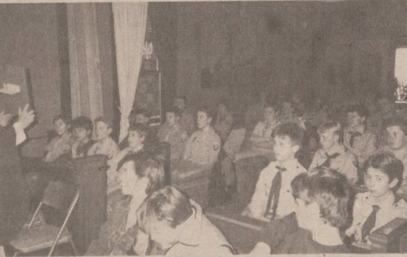
Podczas skupienia — zasłuchani.