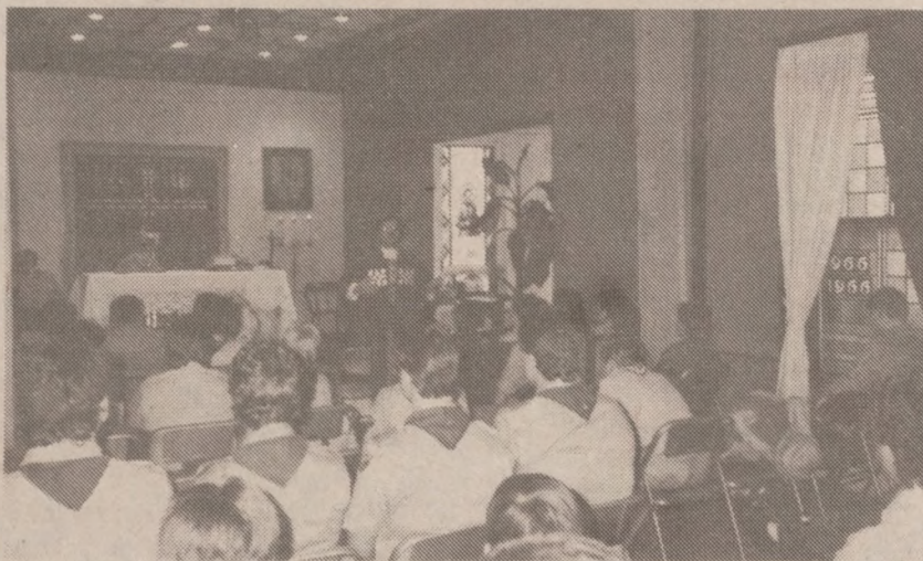
Na skupieniu wielkopostnym.

Prawdziwej modlitwy uczy nas Jezus Chrystus. On jest dla nas wzorem. Nasze Prawo Harcerskie, mówiące o służbie Bogu, chętniej pomocy bliźnim, o pogodzie ducha