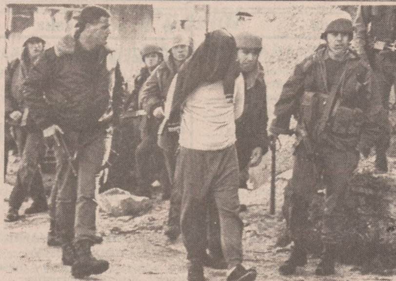
KHABATIYEH — Żołnierze izraelscy aresztowali Palestyńczyka, którego oskarżono o udział w linczu jednego ze swych rodaków uważanego za izraelskiego agenta.

Z pozycji w jakiej znajdowało się ciało policja wnioskuje, że Sotelo został zastrzelony w samochodzie a następnie wypchnięty z niego na zewnątrz.