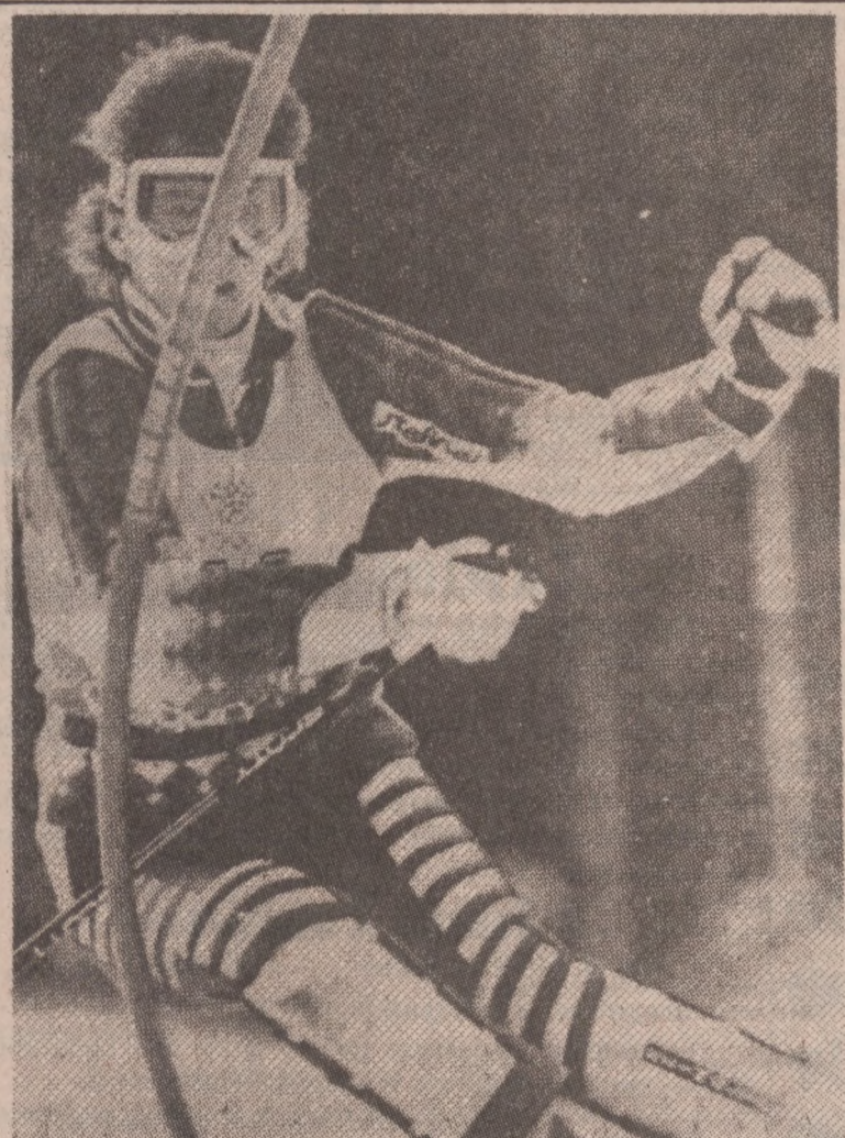
Anita Wachter na trasie slalomu jedzie po złoty medal olimpijski w kombinacji alpejskiej. Ta konkurencja okazała się w Calgary specjalnością Austriaczek.

470 Park Ave. South, (Manhattan, róg 32 ulicy) N.Y., N.Y. 10016 333 North Michigan Ave., Chicago, IL 60601 Tel.: (212) 684-5320 Tel.: (312) 782-3933