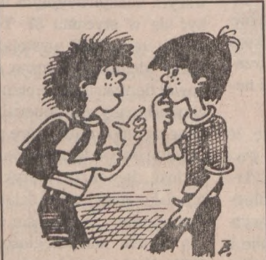
—Wiesz, odkryłem zadziwiające zjawisko—godzina lekcyjna jest o wiele dłuższa od wakacyjnej!

Wpisz nad kropkami brakujące litery. Litery te, odczytane kolejno, utworzą dwuwyrzowe rozwiązanie—imię i nazwisko polskiego botanika, uczonego światowej sławy. Był on czołowym działaczem ochrony przyrody w Polsce.