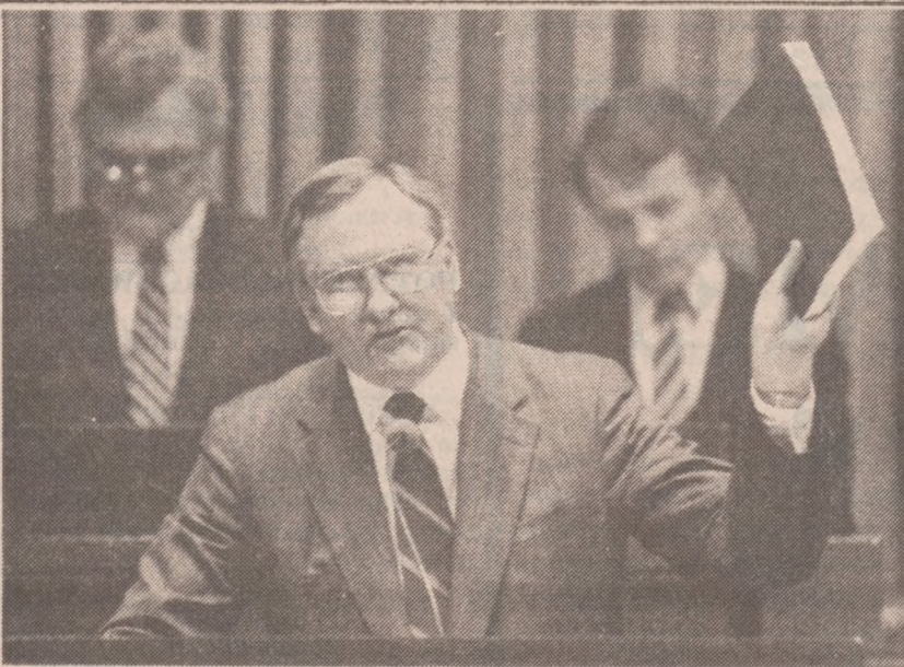
SPRINGFIELD — Gubernator James Thompson podczas przemówienia w stanowym Senacie przedstawił propozycje budżetowe Illinois na rok fiskalny 1989.