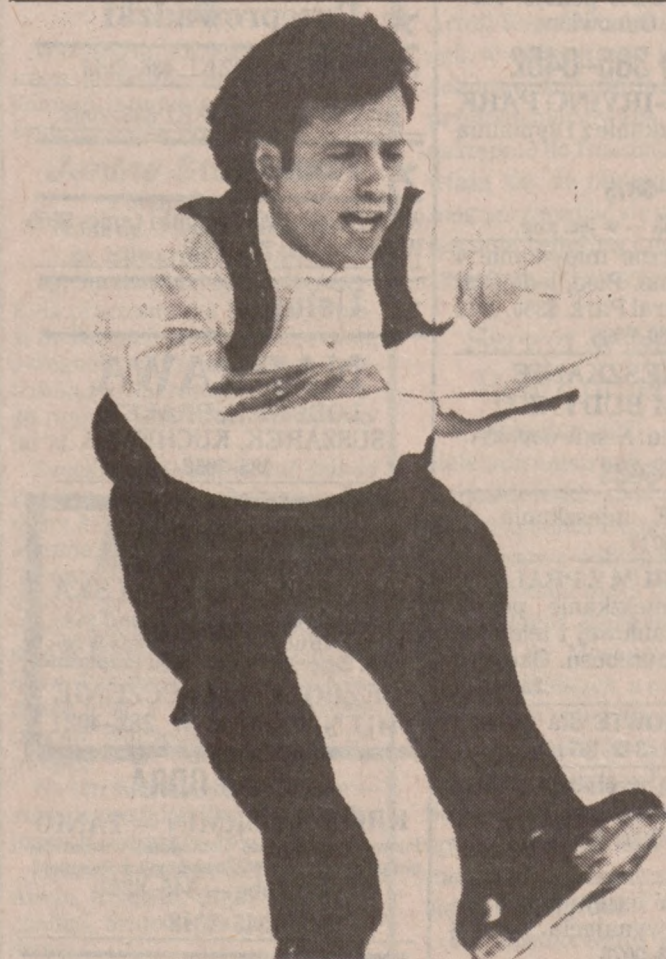
CALGARY — Na tafli lodowej w Calgary niezwykle efektownie zaprezentował się amerykański łyżwiarz Brian Boitano, który zajął pierwsze miejsce i zdobył złoty medal dla barw USA.