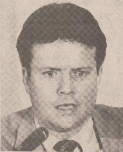
WASHINGTON — W proteście przeciw cięciom w budżecie Pentagonu sekretarz marynarki wojennej James Webb podał się do dymisji.