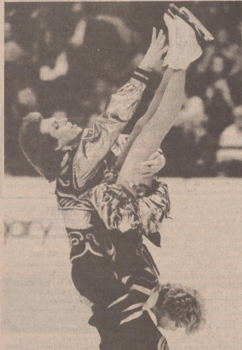
CALGARY — Natalia Bestemianowa i Andriej Bukin zdobyli w Calgary złoty medal. Przysiąc trzeba, iż występ sowieckiej pary był niezwykle efektowny.