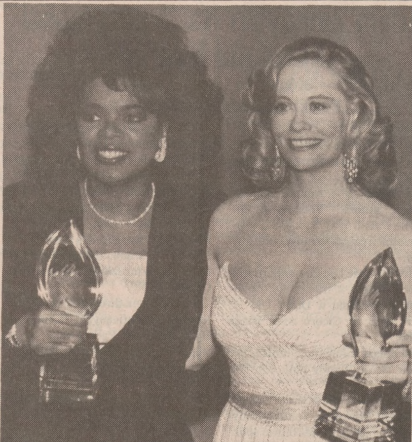
LOS ANGELES—Cybill Shepherd (z prawej) i Oprah Winfrey zostały laureatkami tegorocznych nagród publiczności na najpopularniejsze postacie programów telewizyjnych. Na zdjęciu, laureatki z nagrodami w ręku.

Wolne państwa zachodnie obawiają się, iż komuniści z Korei Północnej mogą planować dalsze akcje terrorystyczne właśnie podczas tegorocznych igrzysk letniej olimpiady.