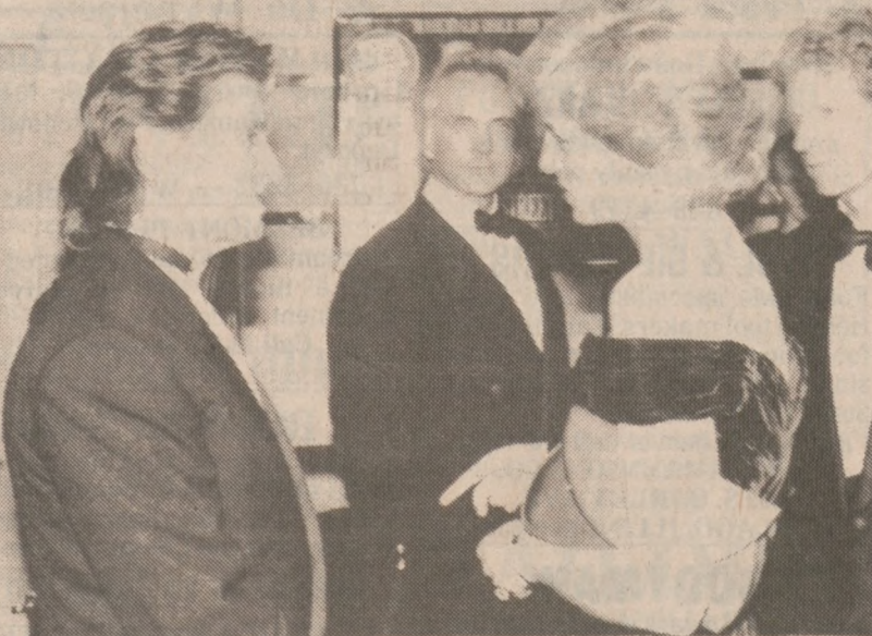
LONDYN — W stolicy Wielkiej Brytanii odbyła się uroczysta premiera filmu "Wall Street", na którą przybyła księżna Diana. Na zdjęciu, księżna Diana rozmawia z odtwórcą roli głównej i zdobywcą filmowego Oscara, Michaeliem Douglasem.