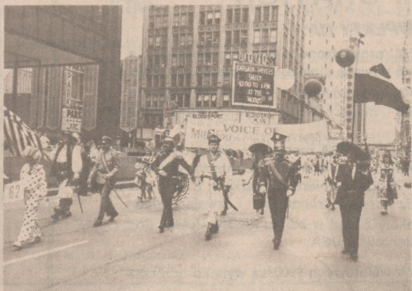
Grupa Polsko-Amerykańskiej Rady Pracy i dalej członkowie Chóru Millarda.