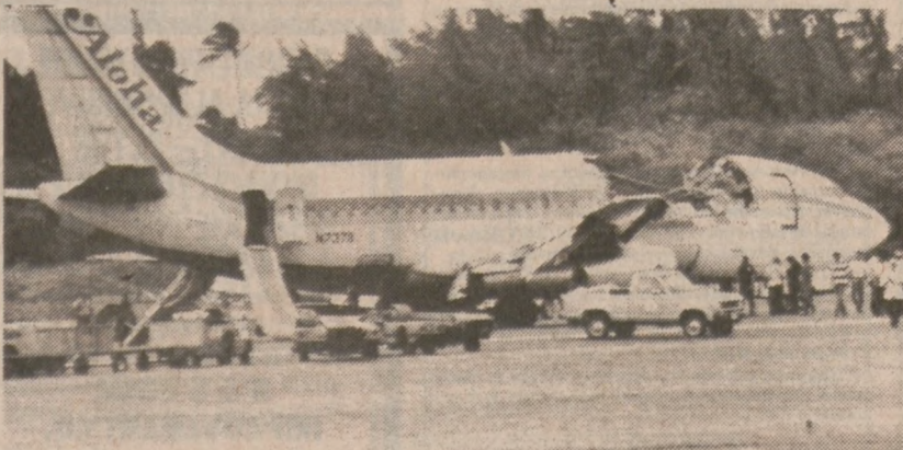
HONOLULU — Tak po wylądowaniu wyglądał samolot linii lotniczych Aloha. Zagadkowa eksplozja wyrwała dużą część kadłuba powodując obrażenia kilkudziesięciu pasażerów. Pilot szczęśliwie sprowadził maszynę na ziemię.