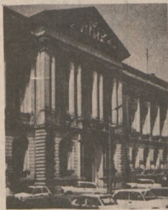
Zabytkowy Budynek Banku PKO w Warszawie

OTWIERA na zlecenia z USA rachunki w polskich bankach dla osób przebywających w Stanach Zjednoczonych lub w Polsce, prowadzone w dolarach, markach RFN, funtach angielskich, oraz frankach francuskich i szwajcarskich PRZEKAZUJE lokaty z kont w banku PKO w Polsce do dyspozycji klientów w USA.