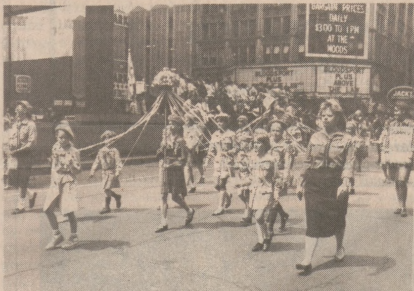
Zuszki — dziewczynki.

Relacja nasza nie ma na celu wyszczególnienia wszystkich bez wyjątku uczestników parady, bo byłoby to niemożliwe. Zresztą listę jednostek biorących udział w para-