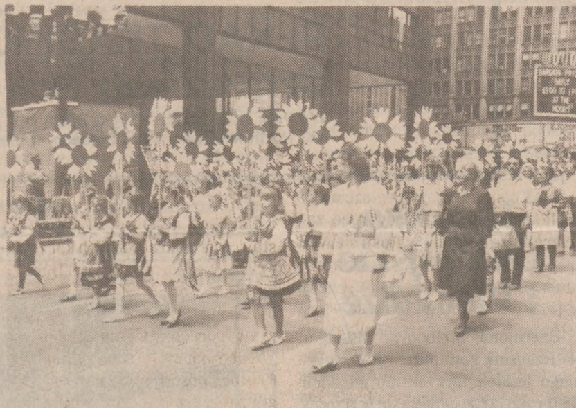
Polska Szkoła im. Emilii Plater.

powe przybranie naszych dzieci występujących w paradzie.