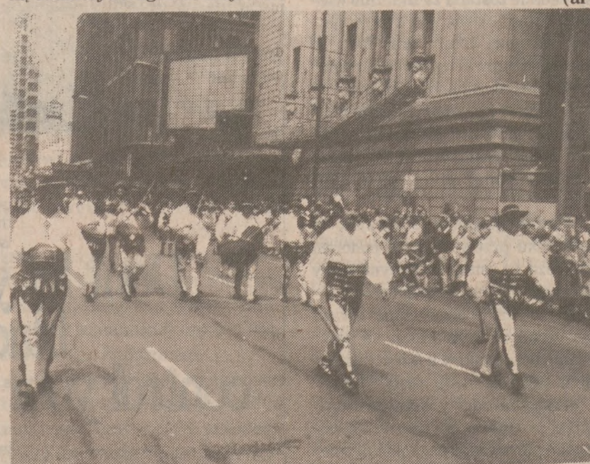
Fragment grupy Związku Podhalan w Ameryce Płn. Na pierwszym planie tancerze.