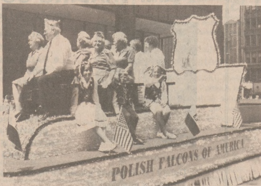
Rydwany Sokolstwa Polskiego w Ameryce.

Najserdeczniej witane i oklaskiwane najbardziej są zawsze w paradach 3-Majowych dzieci i młodzież z Polskich Szkół Sobotnich, Harcerstwa, grup tanecznych klubów młodzieżowych. Tegoroczne wystąpienia młodych ludzi nie było odośnionych.