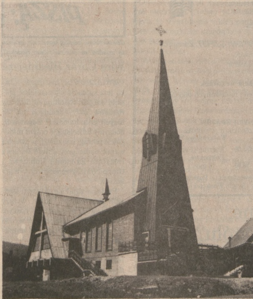
Siostry i Bracia!

Jestem proboszczem rzymskokatolickiej parafii Młyńczyska, 14 kilometrów do Limanowej, leżącej między dwoma pasmami gór Beskidu Sudeckiego.