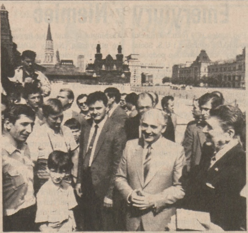
MOSKWA.—Przywódcy USA i Związku Sowieckiego na Placu Czerwonym odbyli rozmowy z grupą mieszkańców Moskwy.

MÓWIĄCY PO POLSKU ADWOKAT JOEL GOULD Jazda w Stanie Nietrzeźwym Wypadki Samochodowe • Rozwody $170 + Koszty Sądowe $150 • Przekroczenia Ruchu Drogowego od $80 • Kradzieże w sklepach • Bójki • Uszkodzenia Cieleśne w Wypadkach (Wysokie Odszkodowania) Zadzwoń Po Umówienie Sie Porady Bezpłatne 281-8744 24 Godziny/7 Dni w Tygodniu 2918 N. MILWAUKEE 205 W. RANDOLPH • POKÓJ 1630