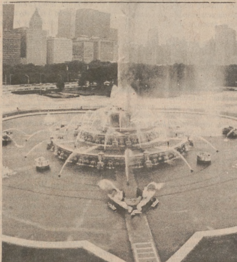
CHICAGO. - Fontanna Buckingham.

Sowiecka telewizja przeprowadziła bezpośrednią transmisję tego wydarzenia. Zadaniem kosmonautów będzie przeprowadzenie 40 eksperymentów podczas 10-dniowego pobytu na stacji "Mir" - gigantycznego laboratorium badawczego.