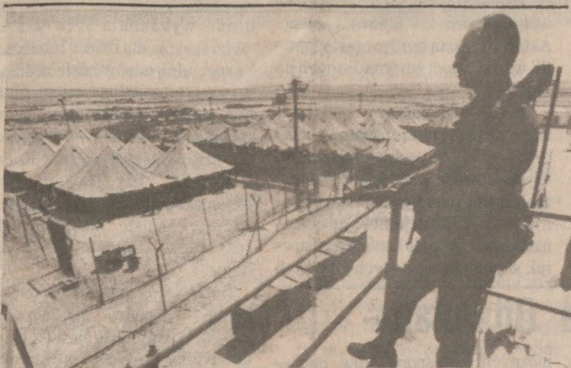
KETZIOT — Tak wygląda prowizoryczne więzienie dla Palestyńczyków z terenów Gazy. Na zdjęciu, izraelski żołnierz strzeże kilkudziesięciu namiotów, gdzie przebywa prawie 2,5 tys. Palestyńczyków.

Podobno władze chińskie zostały zawiadomione o próbie przeprowadzenia terrorystycznego ataku na Amerykanów przez ministerstwo spraw zagranicznych innego państwa.