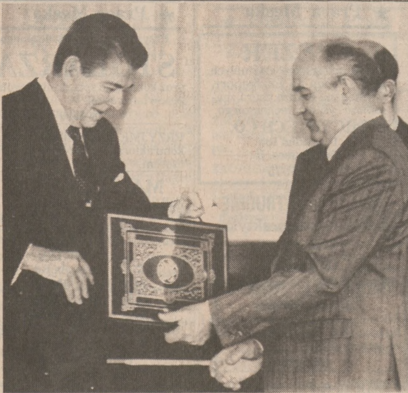
MOSKWA — Prezydent Reagan i Michaił Gorbaczow wymieniają dokumenty ratyfikacyjne zawierające treść porozumienia o eliminacji rakiet średniego zasięgu z arsenałów obu supermocarstw.

Podejrzany nie został oskarżony przez policję w związku z morderstwem.